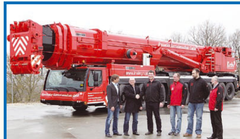
LTM 1500-8.1 für Rostock: Der 500-Tonner ist der vierte neue Liebherr-Mobilkran für „Rostocker Korrosionsschutzunternehmen“ innerhalb von nur zwei Jahren. Damit wird die Mobilkranflotte nach oben hin erweitert.

Den Verantwortlichen zufolge war der AL.SK350 der einzige Kran, der die Anforderungen des Schiffsbauers voll erfüllt, ohne dass der Schiffsrumpf gedreht werden muss.