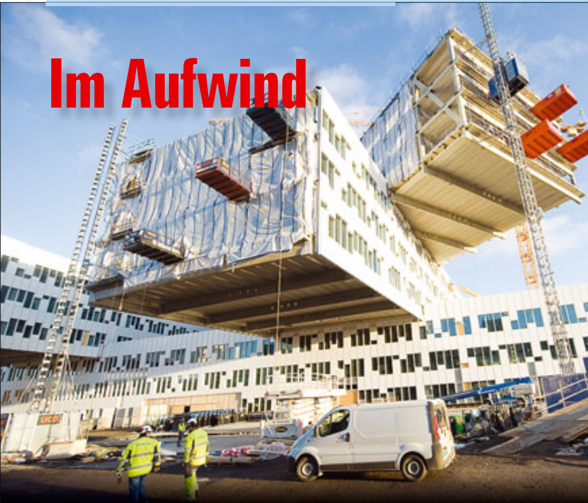
In Oslo entsteht mit „The Five Elements“ spektakuläre Architektur, unterstützt von acht Anlagen von Geda

Sanierungen und Umbauten prägen das Bild in vielen Straßen. Selbst Teile der Frankfurter Skyline wie die Hochhaustürme der Deutschen Bank, das Westend-Gate, das City-Haus oder jetzt der Silberturm wurden komplett saniert. Die Aufzugs- und Mastklettertechnik profitiert davon. Alles Neue von Alexander Ochs.