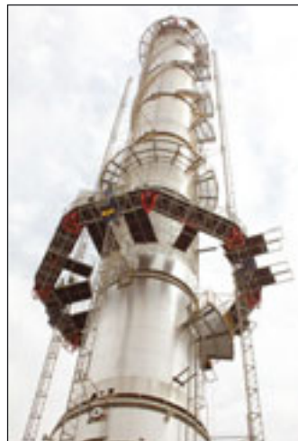
Auch in Slowenien im Einsatz ist diese Spezialkonstruktion von Safi

befindet sich auf dem Level des Brückentisches. Durch die Kombination von Kletterschalung und Bauaufzug kann ein zügiger Baufortschritt garantiert werden. Die Grundeinheit des PH 2032 und die dazugehörigen Mastelemente sind so gefertigt, dass sich der Aufzug an die Struktur des Kühlturms anpasst und die Neigung ausgeglichen wird. An der Bodenstation be-