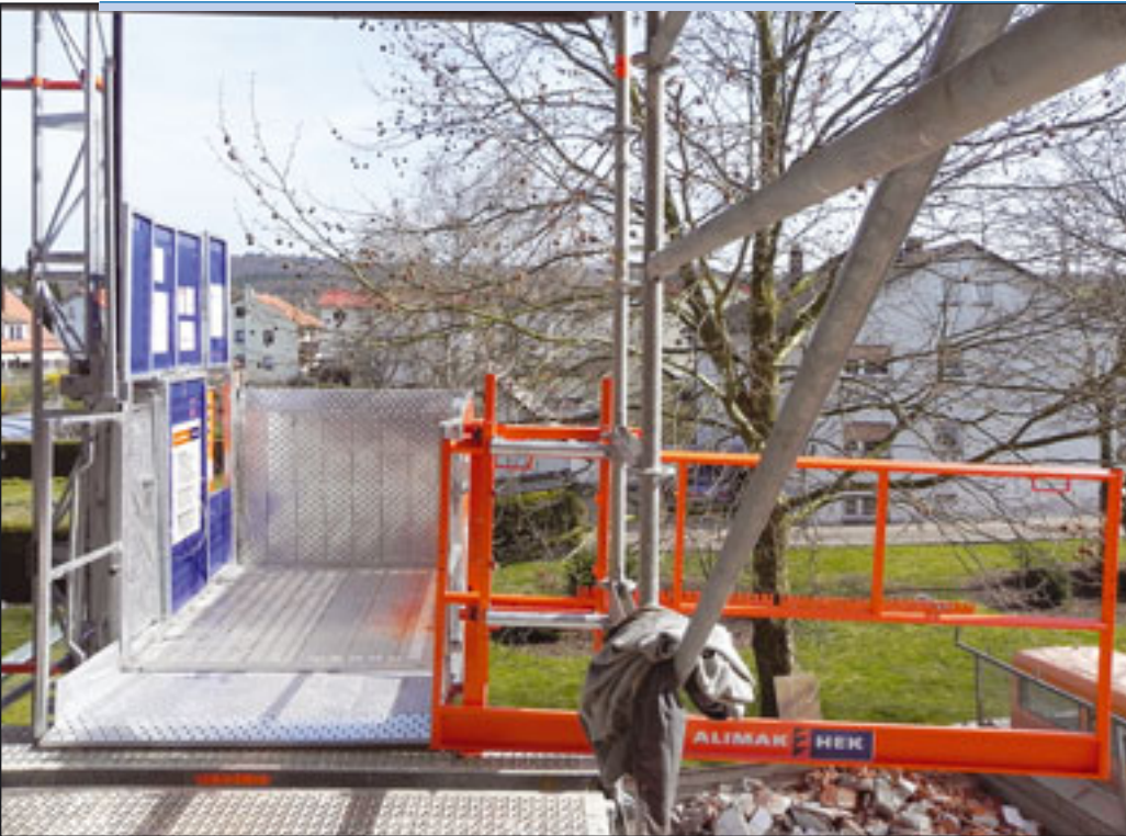
Alimaks neu entwickelte Verankerungsrahmen bestehen aus zwei orangefarbenen Mastadaptern und einem senkrechten Anschlussrohr, hier an der TPL 500 in Eppingen

« Böcker in diesem Jahr erstmals auf der Messe WindEnergy in Husum. Der so genannte Multi-Rail-Lift ist ein Zwei-Komponenten-System, das aus einer robusten Aluminium-Schiene als Systemträger und einer portablen Liftplattform besteht. Die Plattform kann sowohl Menschen als auch Material in die Höhe bringen. Mit nur wenigen Handgriffen lässt sich die Liftplattform in das fest installierte Schienensystem einklinken, und schon kann es losgehen. Ein leistungsstarker Elektromotor, betrieben mit einem Lithium-Ionen-Akku mit 230 Volt- oder KFZ-Bordnetzladegerät, ermöglicht die Beförderung von einer Transportlast bis zu 150 Kilogramm. Bedient wird das System mit einer handlichen Fernbedienung, die das stufenlose Stoppen in jeder Höhe ermöglicht. Eine sanfte Anlauf- und Bremsfunktion gewährleistet zudem das sichere Arbeiten in Höhen bis zu 300 Metern. Perfekt also für Windkraftanlagen und Konsorten. Dabei lässt sich der Multi-Rail-Lift bequem im Kombi transportieren und auf steckbaren Rädern zum Einsatzort fahren. Da es vergleichsweise luftig zugeht, ist Mensch und Material mehrfach gesichert. Der Nutzer ist pflichtgemäß mit einer unabhängigen Fallschutzsicherung verbunden. Per Karabinerhaken wird diese am persönlichen Auffanggurt des Anwenders fixiert und läuft automatisch mit. Im Fall eines Sturzes hakt sich der Karabiner über eine Sicherheitsklinke in die Schiene ein und verhindert so den Fall – aufgrund der integrierten Falldämpfung geschieht dies sanft und ohne Verletzungsgefahr.