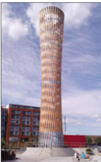
Im 40 Meter Danes Yard Landmark Tower in London versteckt sich ein permanent installierter SE 630FC von Alimak Hek

Doch nicht nur die angesprochenen Hochhaustürme der 60er bis 80er Jahre sind früher oder später ein Sanierungsfall, ►►