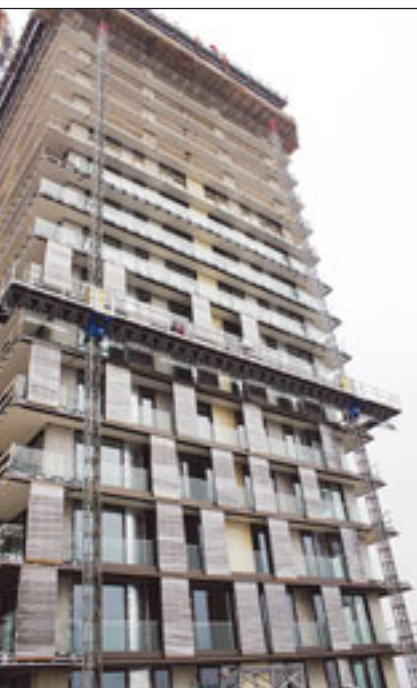
Mabers MB P 02/150 mit 28 Metern Breite in Ljubljana

Modulen bestückt. Für die Photovoltaik-Fassade wurden Scanclimber SC4000-Bühnen mit einer mitfahrenden Kranschiene ausgestattet, die das Heben der Elemente wesentlich erleichtert. Herausragende Neuheit auf der Baustelle ist allerdings die neue „Triple“-Bühne. Es handelt sich um eine multifunktionale Maschine, die drei wichtige Punkte abdeckt: erstens die Funktion als Transportbühne für Material und Personen in einer offenen Bühne, zweitens den klassischen Materialtransport und drittens eine mit Modulen erweiterbare Option als Baustellen-Personen- und Lastenaufzug mit geschlossenem Fahrkorb. Sie ist Teil einer neuen Modellserie, die als Ein-Mast-Version eine Tragkraft von bis zu 850 und als Doppelmastversion bis zu 2.000 Kilogramm aufweist. Gezeigt wurde sie bereits auf der Intermat im Frühjahr, aber erst jetzt ist sie in der Version als Personen- und Lastenaufzug lieferbar. »