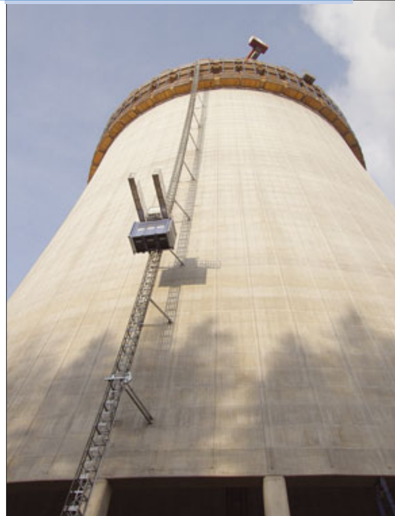
Der Geda PH 2032 kletterte an diesem Kühlturm in Slowenien mit der Schalung auf 156 Meter

Der deutsche Hersteller liefert weltweit Personen- und Materialaufzüge, Industrienaufzüge und Fassadenbefahranlagen. Kleine 60-Kilogramm-Seilaufzüge für den Handwerker bis hin zu 3,2 Tonnen Personenaufzügen mit Hubhöhen bis zu 400 Metern umfasst die Produktpalette von Geda. Ein guter Querschnitt daraus kam bei einem architektonisch herausragenden Bürogebäude zum Einsatz, dem „Five Elements“ in der norwegischen Hauptstadt Oslo. Auf