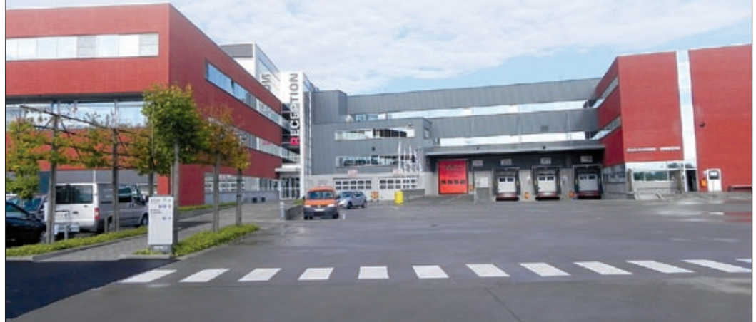
Der Haupteingang von TVH im belgischen Waregem