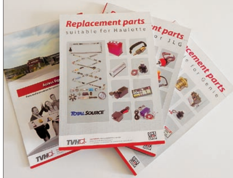
Die Kataloge von TVH

riesiger Stellfläche. Für mich persönlich ist der Hauptsitz von TVH einer der beeindruckendsten Standorte, die ich in meiner 30-jährigen Laufbahn in der Kran- und Bühnenbranche besichtigen durfte. K&B