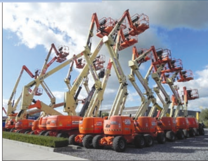
Die Mietflotte von Gunco/TVH

◀ HDW, Genie-Distributor für Benelux. Letztes Jahr wurde das gesamte Vermietgeschäft des Unternehmens unter dem Namen Gunco vereint. Heute laufen mehr 10.000 Einheiten in der Mietflotte, was TVH/Gunco zur Nummer 6 europaweit macht, hinter Lavendo, Loxam, Riwal, Cramo und Ramirent. Ein „Major Player“ in Sachen Arbeitsbühnen, vor allem in den Benelux-Staaten.