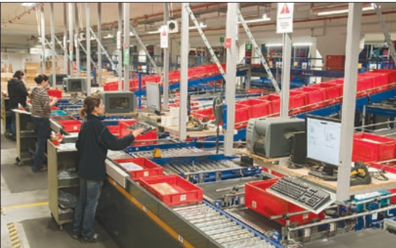
Hier wird die Ware für den Versand vorbereitet