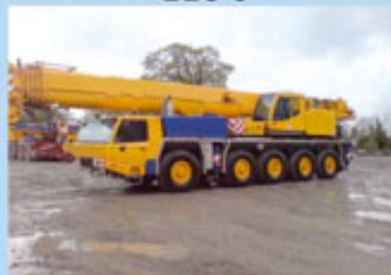
Tadano Faun ATF 110G-5, 2006