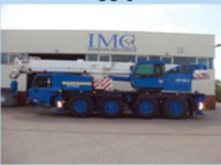
Tadano Faun ATF 60-4, 2000