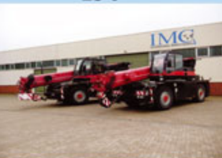
2 x Demag AC 25, 1998