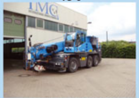
Demag AC 40, 2003