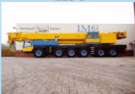
Liebherr LTM 1225, 1999 mit Superlift