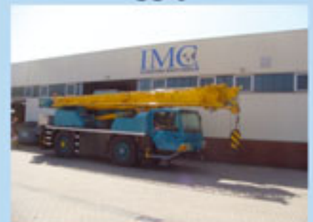
Liebherr LTM 1030-2, 2002