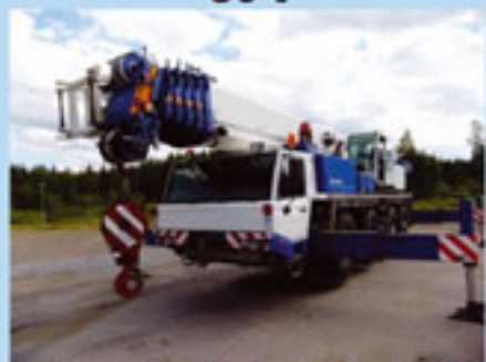
Tadano Faun ATF 80-4, 2002