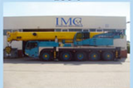
Demag AC 100, 2006