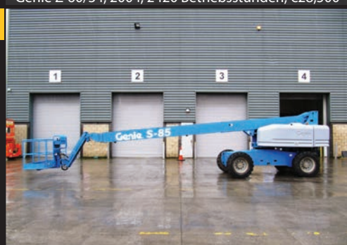
Genie S-85 4WS, 2005, 2647 Betriebsstunden €49,750