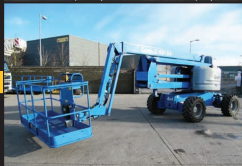
Genie Z-60/34, 2004, 2420 Betriebsstunden, €28,500