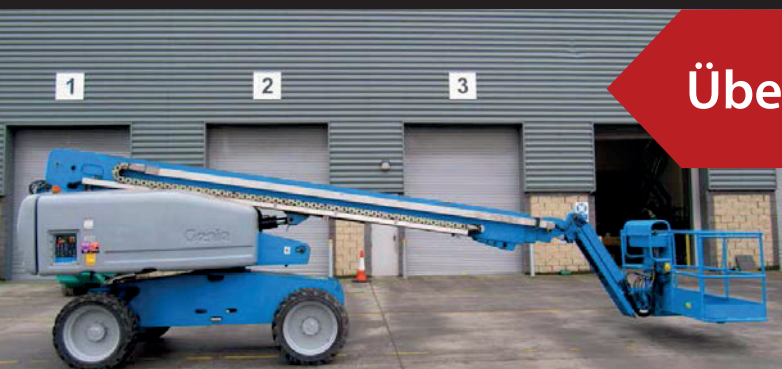
Genie S-65 4WD, 2005, 2950 Betriebsstunden, €32,500