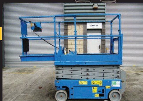
Genie GS-1932, 2005, 248 Betriebsstunden, €5,500