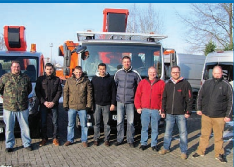
Die Firma Willenbrock Arbeitsbühnen aus Bremen hat fünf LKW-Arbeitsbühnen bei Ruthmann geordert und geliefert bekommen, drei T 330 und zwei TB 220.2. Die Neuzugänge ergänzen ab sofort die Vermietflotte in den Stationen Hannover, Bremen, Bremerhaven und Wilhelmshaven.