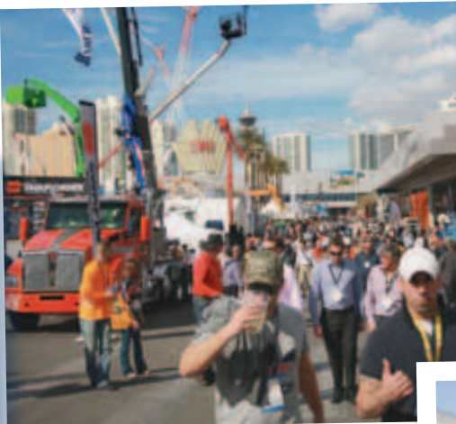
Viel los war stets im Silver Lot