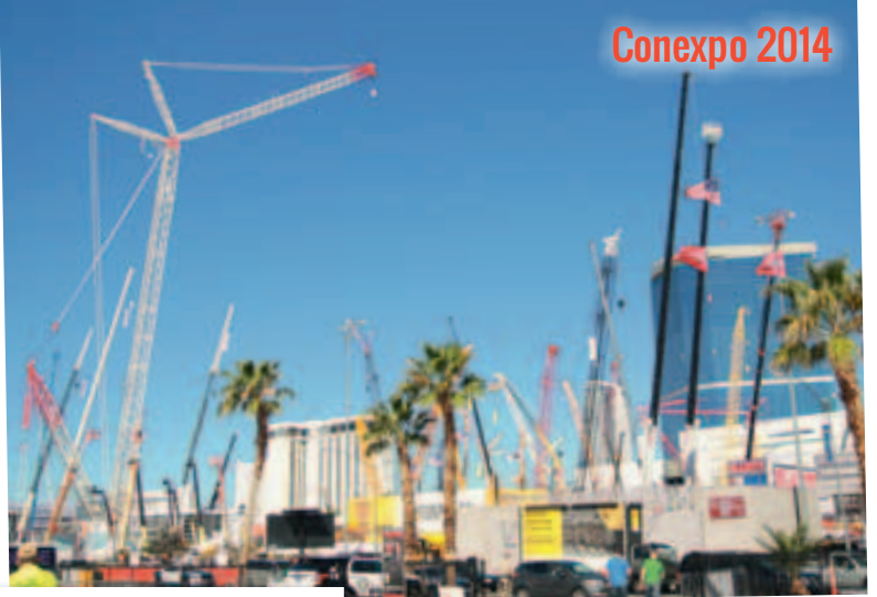
„Skyline“ der Messe