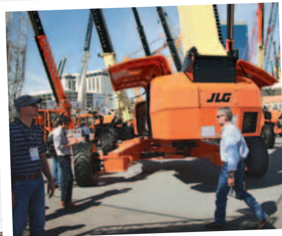
Dem neuen Ultraboom 1850Sj von JLG wurde genau unter die Haube geschaut

Der Stand des Vertikal Verlags im Gold Lot bot wortwörtlich das gewohnte Bild – in Form eines Wohnwagens. Viele kamen vorbei und nutzten die Gelegenheit auf ein Schwätzchen oder eine Tasse Kaffee. Zu bestaunen gab es eine ganze Reihe von interessanten Neuheiten aus allen Segmenten – vom jüngsten JLG-Boomlift über Manitowocs neues Gegengewichtssystem für Raupenkranen bis hin zu gleich zwei neuen AT-Kranen im 160-Tonnen-Klassement: einmal von Terex, einmal von Liebherr. <<