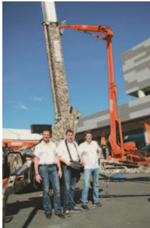
Auffällig: Die Camouflage-Maschine Leo 23GT des Teupen-Teams