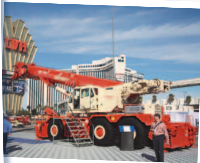
Tadano Faun zeigte seinen neuen RT-Kran