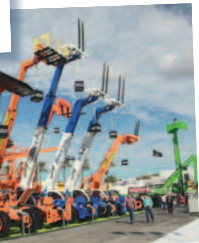
Xtreme und Snorkel – der erste gemeinsame Auftritt