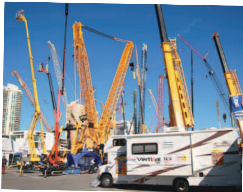
Mit einem Wohnmobil war Kran & Bühne wieder auf der Conexpo 2014 als Aussteller an Bord