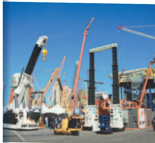
Jekko, Mobilift und die großen Mobilkranhersteller waren allesamt im Gold Lot