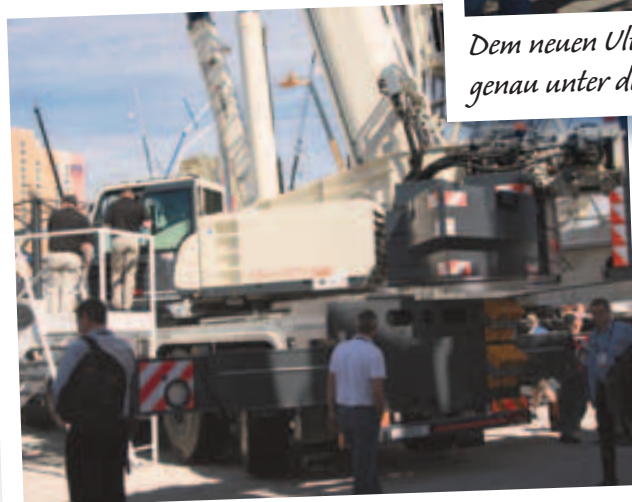
Premiere feierte auch der Terex Explorer 5600 mit 160 Tonnen Traglast