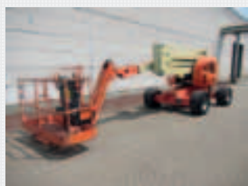
V14392 - JLG 510AJ - 2006 Diesel 4x4 - 17.81 Mtr. - 2317 Std. € 21.500