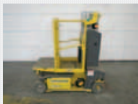
V14246 - JLG Toucan Duo - 2008 Elektrisch - 6 Mtr. - 1442 Std. € 4.000