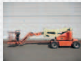
V15643 - JLG M400AJP - 2001 Bi-Energie - 14.19 Mtr. - 1199 Std. € 11.500