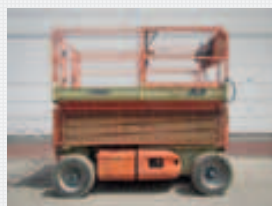
V14251 - JLG 3369LE - 2003 Elektrisch - 12.06 Mtr. - 231 Std. € 6.950