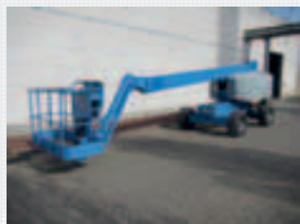
V15619 - Genie S45 - 2003 Diesel 4x4 - 15.70 Mtr. - 5457 Hrs. € 11.500