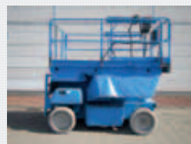
V15510 - JLG 3969E - 2000 Elektrisch - 14 Mtr. - 384 Std. € 5.250