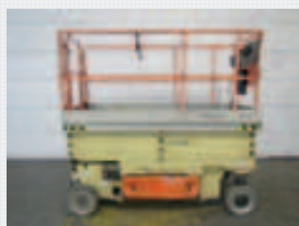
V15113 - JLG 2646ES - 2006 Elektrisch - 9.80 Mtr. - 333 Std. € 6.500 - NEUE REIFEN!