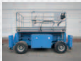
V15528 - JLG 33RTS - 2000 Diesel 4x4 - 12.06 Mtr. - 4588 Std. € 5.000