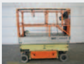
V15646 - JLG 1930ES - 2005 Elektrisch - 7.60 Mtr. - 212 Std. € 4.250