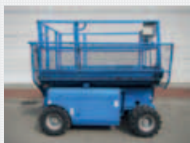
V15496 - Genie GS2668RT - 1999 Diesel 4x4 - 9.90 Mtr. - 3957 Std. € 4.250