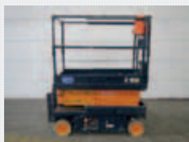
V15055 - Snorkel S1930E - 2006 Elektrisch - 7.60 Mtr. - 303 Std. € 3.250