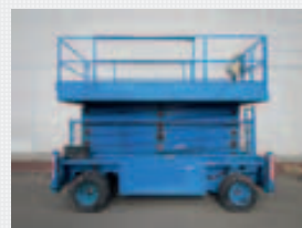
V15291 - Hollandlift B195DL25 - 1999 Diesel 4x4 - 21.50 Mtr. - / Std. € 12.500