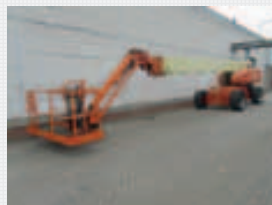
V13870 - JLG 1350SJP - 2004 Diesel 4x4x4 - 43.15 Mtr. - 4870 Hrs. € 62.500