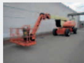
V15475 - JLG 1250AJP - 2007 Diesel 4x4x4 - 40.10 Mtr. - 4046 Std. € 85.000