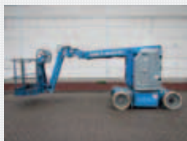
V14890 - Genie Z30/20NRJ - 2003 Elektrisch - 10.89 Mtr. - 996 Std. € 11.500