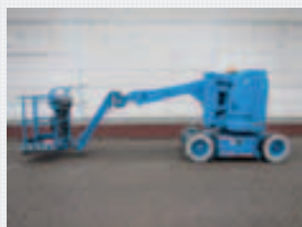
V15217 - JLG E300AJP - 2000 Elektrisch - 11.14 Mtr. - 1090 Std. € 8.750