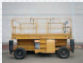
V14517 - Haulotte H12SX - 2006 Diesel 4x4 - 12 Mtr. - 1780 Std. € 7.950