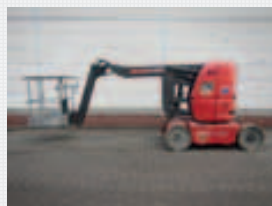
V15141 - Manitou 120AETJ 3D - 2003 Elektrisch - 11.95 Mtr. - 971 Std. € 10.500