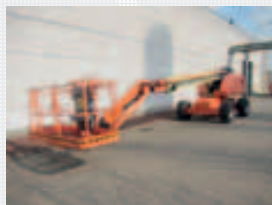
V15484 - JLG 660SJ - 2007 Diesel 4x4 - 22.32 Mtr. - 2358 Hrs. € 36.000