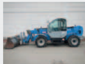
V15590 - Genie GTH3512 - 2007 Diesel 4x4x4 - 12.12 Mtr. - 2372 Hrs. € 23.000