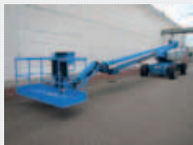
V15492 - Genie S105 - 2009 Diesel 4x4x4 - 34 Mtr. - 1130 Hrs. € 82.500