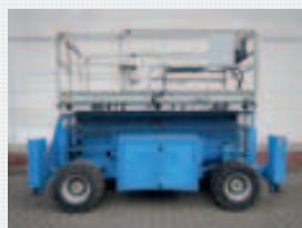
V15539 - JLG 40RTS - 2001 Diesel 4x4 - 14.04 Mtr. - 3676 Std. € 6.750