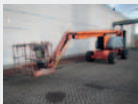
V15247 - JLG 800AJ - 2002 Diesel 4x4 - 26.38 Mtr. - 3646 Std. € 28.500