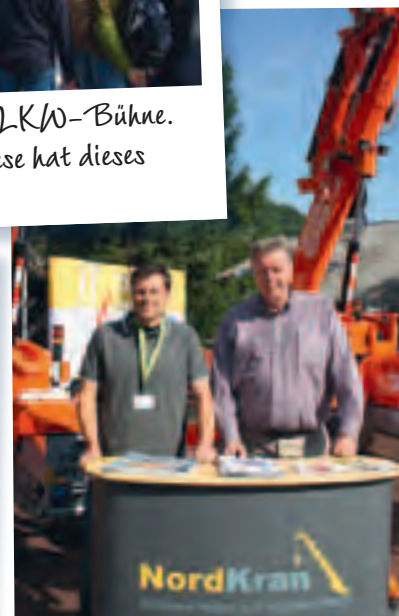
Ihr 'Platformers'-Debüt gab die Firma Nordkran