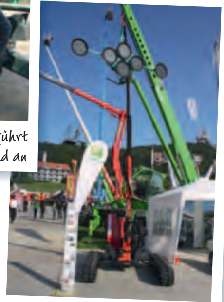
Rot-Grün: TGT's Glasroboter vor Merlos Telesaplern