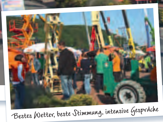
Bestes Wetter, beste Stimmung, intensive Gespräche