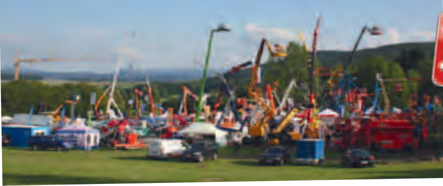
Aus dem Dornröschenschlaf erwacht: der Hessen Hotelpark Hohenroda