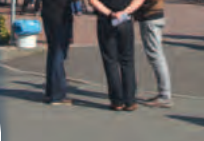
Die ganze Zeit über war viel los