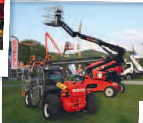
Mit seinem Gelenkteleskop Mango 12 will Manitou durchstarten