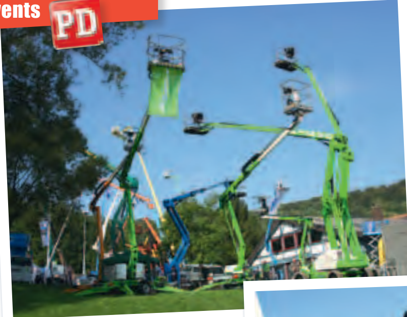
Das Aufgebot von Niftylift