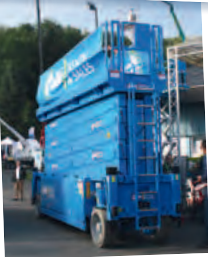
Wiedergänger: Collé mit H&B-Schere S320