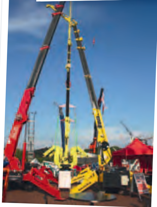
Zwei Minikrane von Unic packen ihren kleinen „Bruder“ an den Haken