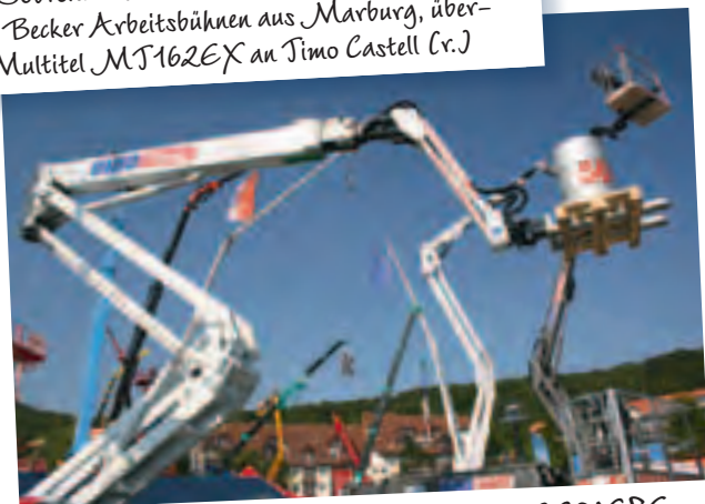
Dinolifts neue Mehrzweckbühne 220XSE mit Gabelzinken