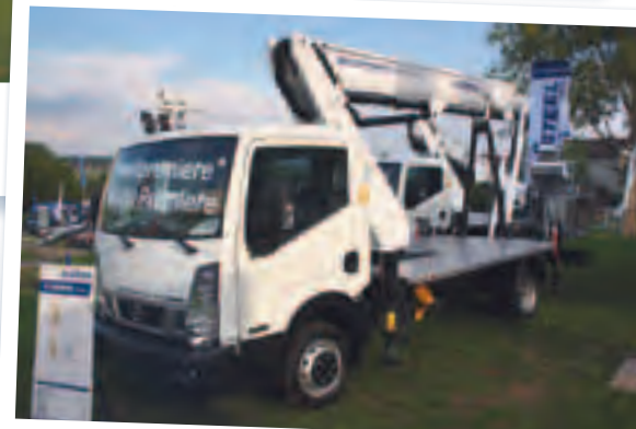
Öil & Steel fuhr zusammen mit dem Händler Bauscher groß auf mit gleich dreifacher Weltpremiere