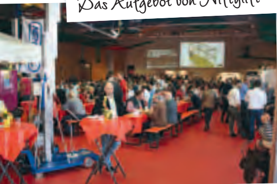
Full House auch in der Halle