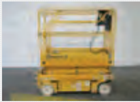
V18563 - Haulotte Optimum 8 - 2006 Electric - 7,76 Mtr. - 395 Hrs. € 3.950