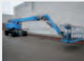
V19361 - Haulotte H28TJ - 2009 Diesel 4x4 - 28,2 Mtr. - 3557 Hrs. € 37.500