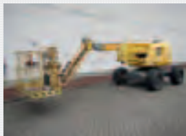
V18713 - Haulotte HA16SPX - 2006 Diesel 4x4 - 16 Mtr. - 3233 Hrs. € 15.500