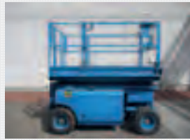
V18338 - Genie GS3268RT - 2001 Diesel 4x4 - 11,75 Mtr. - 3381 Hrs. € 5.500