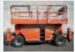
V18261 - JLG 4394RT - 2006 Diesel 4x4 - 15,11 Mtr. - 2490 Hrs. € 15.500