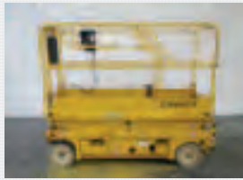
V18632 - Haulotte Compact 8 - 2005 Electric - 8,2 Mtr. - 167 Hrs. € 3.750