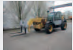
V19523 - Genie GTH4017 EX - 2011 Diesel 4x4 - 16,72 Mtr. - 17 Hrs. € 42.500