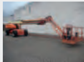
V17527 - JLG 1350SJP - 2006 Diesel 4x4 - 43,15 Mtr. - 3629 Hrs. € 67.500