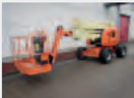
V18746 - JLG 450AJ - 2007 Diesel 4x4 - 15,72 Mtr. - 3245 Hrs. € 19.950