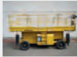
V19111 - Haulotte H15 SXL - 2005 Diesel 4x4 - 15 Mtr. - 2362 Hrs. € 12.750