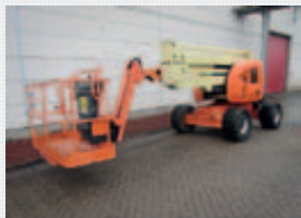
V18746 - JLG 450AJ - 2007 Diesel 4x4 - 15,72 Mtr. - 3245 Hrs. € 19.950