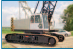
SCX800 80t 2009