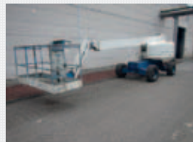
V19577 - Genie S45 - 2005 Diesel 4x4 - 15,7 Mtr. - 3939 Hrs. € 13.500