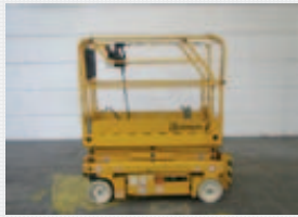
V18572 - Haulotte Optimum 8 - 2006 Electric - 7,76 Mtr. - 483 Hrs. € 3.950