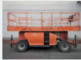
V18433 - JLG 3394RT - 2004 Diesel 4x4 - 12,06 Mtr. - 2130 Hrs. € 11.500