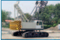
SCX900 90t 2008