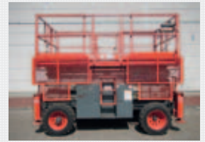
V18873 - Skyjack SJ8841 - 2004 Diesel 4x2 - 14,5 Mtr. - 2543 Hrs. € 9.500