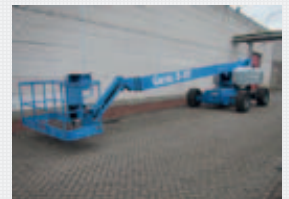
J19153 - Genie S85 - 2007 Diesel 4x4 - 27,9 Mtr. - 1737 Hrs. € 51.000