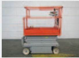
V17772 - Skyjack SJ3219 - 2008 Electric - 7,8 Mtr. - / Hrs. € 3.950