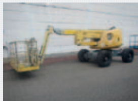
V18716 - Haulotte HA16SPX - 2006 Diesel 4x4 - 16 Mtr. - 4294 Hrs. € 14.500