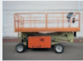
V17386 - Upright SL30SL - 2007 Diesel 4x4 - 11 Mtr. - / Hrs. € 9.500