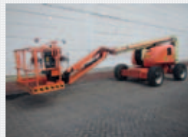
V19644 - JLG 600AJ - 2006 Diesel 4x4 - 20,29 Mtr. - 3610 Hrs. € 28.500