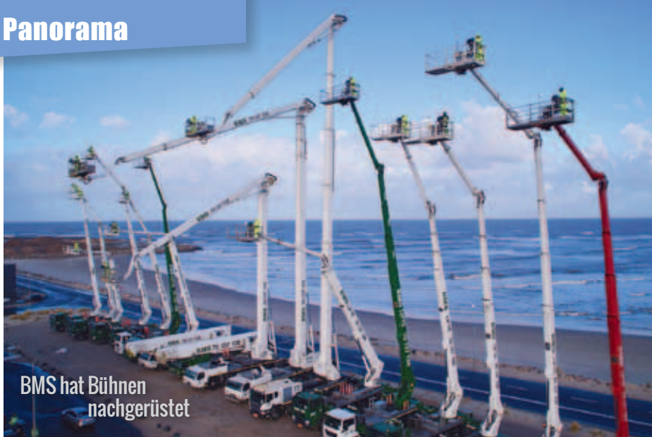
BMS hat Bühnen nachgerüstet