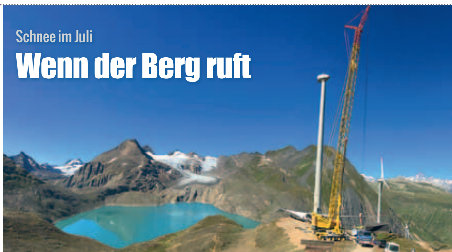
Schnee im Juli