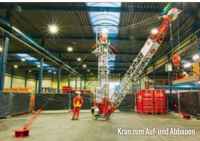
Kran zum Auf- und Abbauen

die Aufgabe, den Marktführer im Premiumbereich der Hubarbeitsbühnen zusammen mit dem Teupen-Team bei der weiteren Entwicklung und dem Ausbau der Marktposition zu begleiten. Produkte wie der Puma 42GTX zeigen die herausragende Kompetenz des Premiumanbieters.“ <<