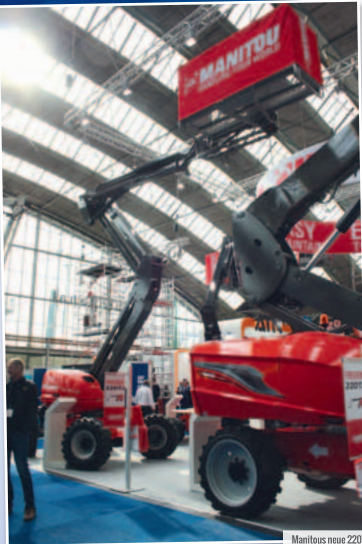
Manitous neue 220TJ erweitert die Palette nach unten