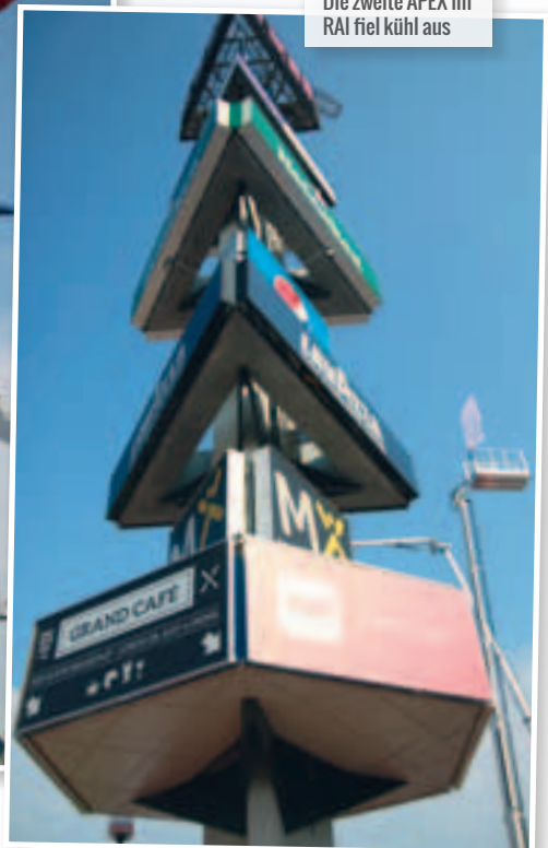
Die zweite APEX im RAI fiel kühl aus