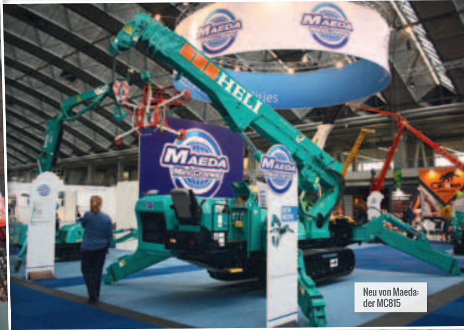
Neu von Maeda: der MC815