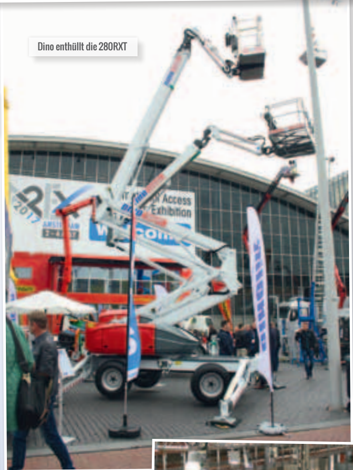
Dino enthüllt die 280RXT