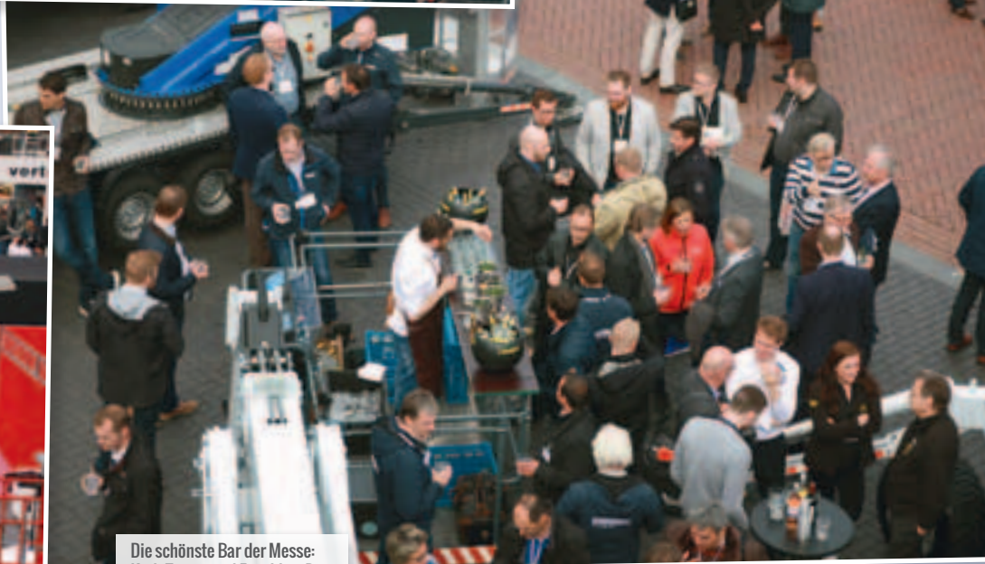
Die schönste Bar der Messe: Korb-Tresen und Frischluft-Bar