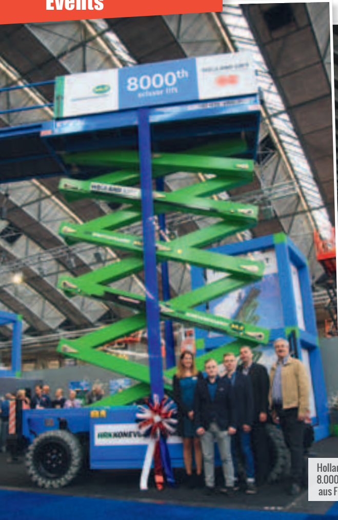
Holland Lifts Nummer 8.000 geht an HRK aus Finnland