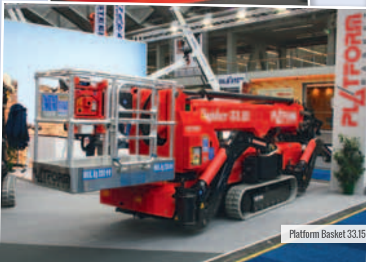
Platform Basket 33.15