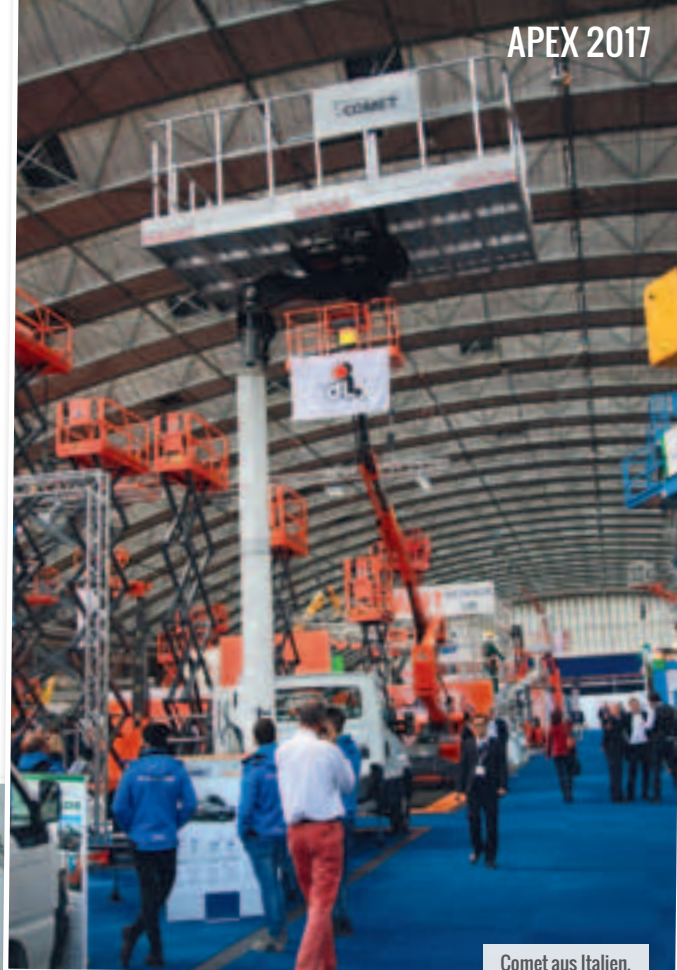
Comet aus Italien, Dingli aus China

Bei den Brot-und-Butter-Maschinen war kein „Game Changer“ am Start. Bei den Nischenprodukten sind einige frische oder wiederbelebte Ideen zu finden. Wer zum Beispiel in Holland unterwegs ist, weiß es nur zu gut: Der Untergrund braucht ein besonderes Augenmerk. Der Bodendruck darf bei Sand nicht zu hoch sein. Kein Wunder also, wenn hier Kettengeräte sich einer gewissen Beliebtheit erfreuen. Davon ist auch Catamount überzeugt – ein neuer Name unter den Anbietern, der gerne in die Aichi-Lücke stoßen würde und sein Kettengerät mitgebracht hat. Bei den LKW-Bühnen wurde die Idee der Großplattform wieder aufgegriffen, und das gleich von zweien: Comet und SkyAccess Trade. Im Kleinen zeigte beispielsweise Böcker eine Idee des Höhenzugangs bis 4,5 Meter Arbeitshöhe, die lediglich mit einem Gasdruckzylinder auskommt. Was der Markt davon annimmt, das bleibt – wie bei vielen Neuheiten – offen. Eine wahre Premierenstimmung blieb aber aus. >>