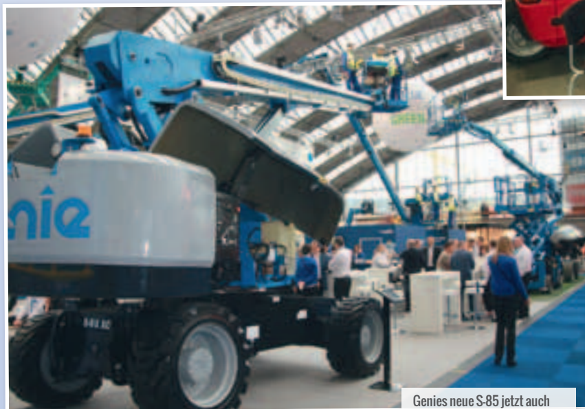
Genies neue S-85 jetzt auch mit XC, also extra viel Korblast