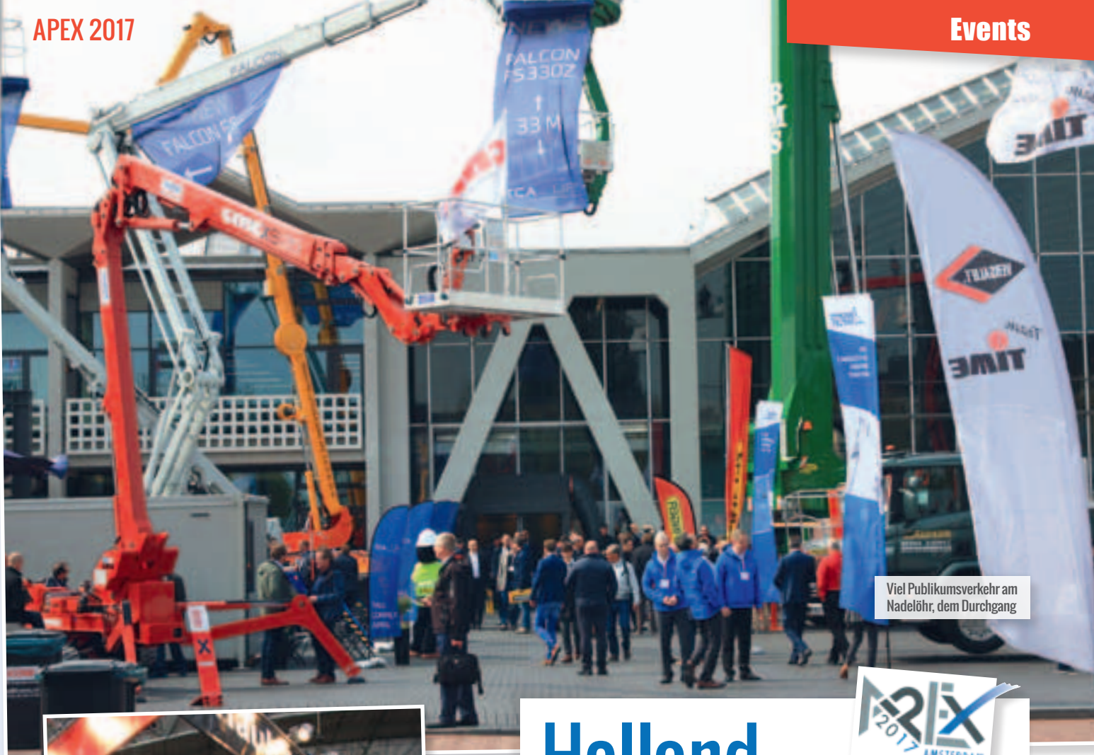
Viel Publikumsverkehr am Nadelöhr, dem Durchgang