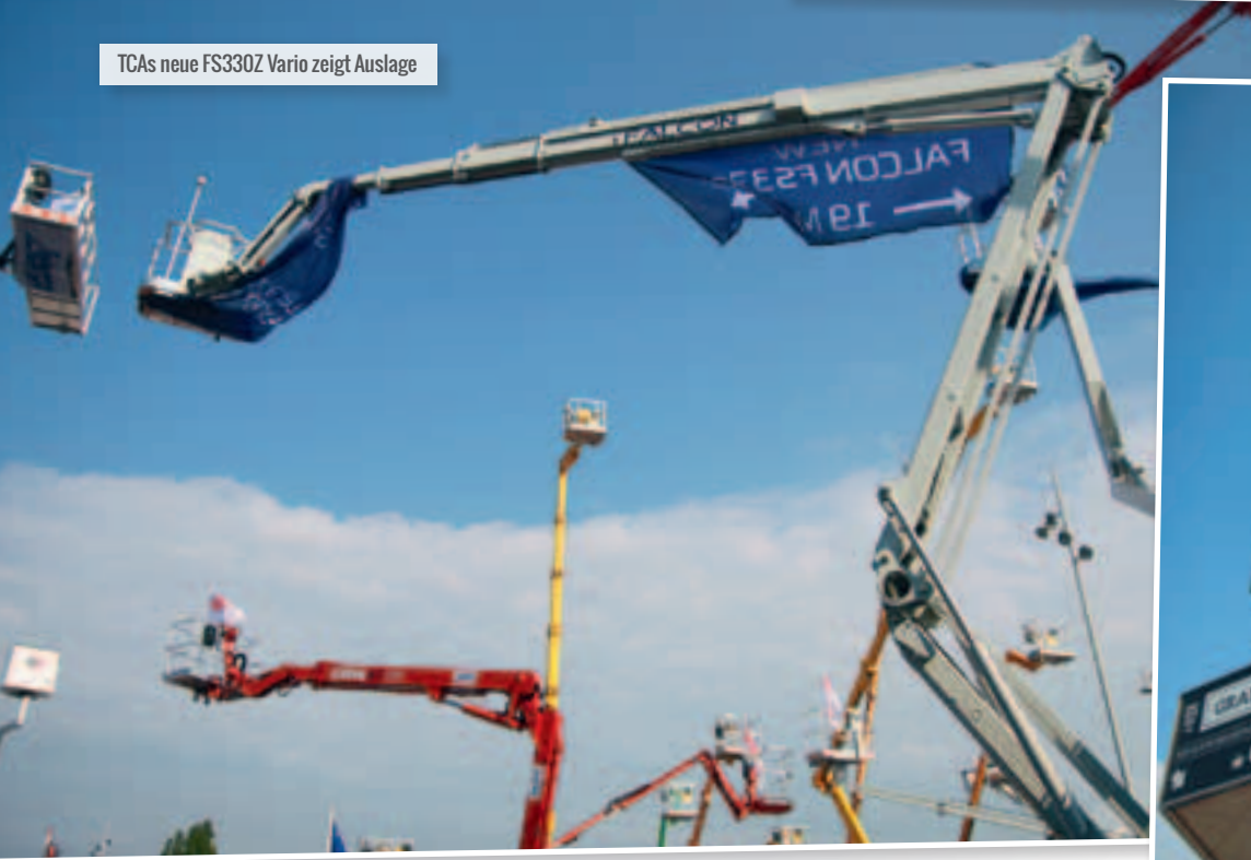
TCA's neue FS330Z Vario zeigt Auslage