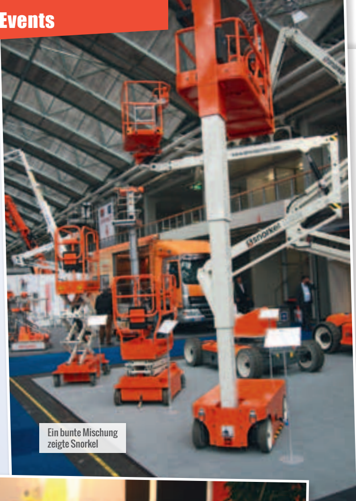
Ein bunte Mischung zeigte Snorkel

Ein zweiter Trend ist augenfällig, allerdings durch die Abwesenheit der Geräte. Teleskoplader sind in diesem Jahr kaum ein Thema gewesen. Gerade mal zwei Geräte waren auf der Messe zu entdecken. Es war aber von niemanden Bedauern zu hören, dass diese Stapler in Amsterdam nicht großartig vertreten waren. >>