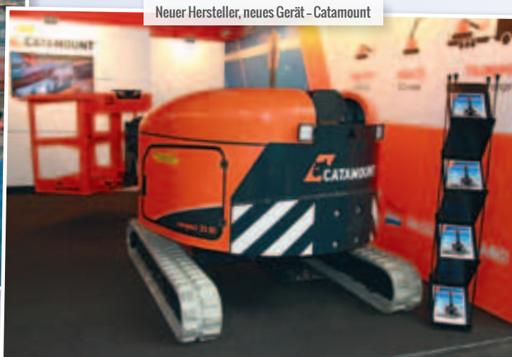
Neuer Hersteller, neues Gerät - Catamount