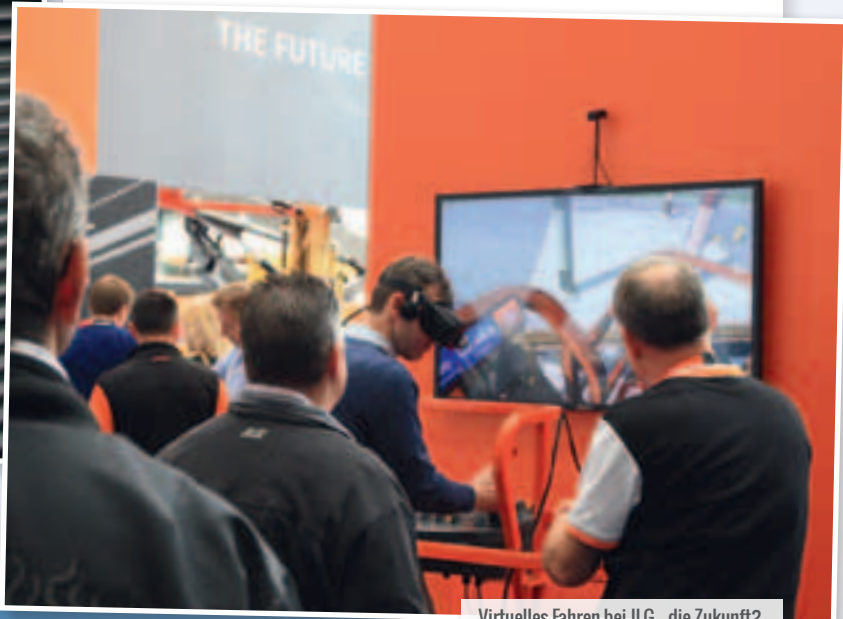
Virtuelles Fahren bei JLG - die Zukunft?

» Es war also ausreichend Platz für anderes Neues. Wie wurde dieser genutzt? Zum einen wurde natürlich all das auf dieser Seite des Atlantiks gezeigt, was als Neuheit auf der Conexpo zu sehen war. Zum anderen wurden sehr viele Gerätschaften neu aufgelegt und an die Zeit angepasst. Gerade bei den LKW-Bühnen mit der neuen Euro6-Norm hat sich redlich viel getan. Kaum zu übersehen war dabei sicherlich die neue Palfinger P1000 – 103 Meter Arbeitshöhe auf 5-Achs-Fahrgestell. Ein anderer Trend aber ist, dass inzwischen Neuheiten auf einer Messe schon auf Papier angekündigt werden, so zum Beispiel Ruthmann mit seiner (mindestens) 90-Meter-Bühne. Diese haben ihren Live-Auftritt, gegossen in Stahl, dann später. Angekündigt wird sie schon mal als „vielseitigste und leistungsstärkste LKW-Bühne der Welt“ – und das auf Standardchassis. Wer nach Amsterdam kam, das kann man für die überwiegende Mehrheit sagen, ging zufrieden wieder nach Hause. Kein Wunder also, dass jetzt schon feststeht, dass 2020 das nächste Mal zur APEX geladen wird. Schade nur, dass der genaue Termin noch nicht feststeht. K&B