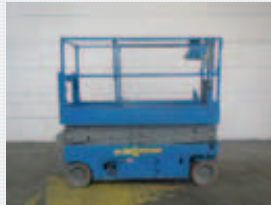
V22473 - Genie GS2032 - 2007 Electric - 8,1 Mtr. - 720 Hrs. € 4.500