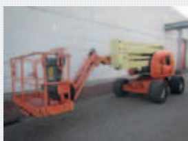
V18747 - JLG 450AJ - 2007 Diesel 4x4 - 15,72 Mtr. - 3044 Hrs. € 18.950