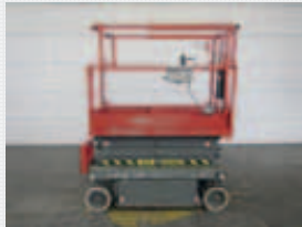
V20133 - Skyjack SJ3219 - 2007 Electric - 7,8 Mtr. - 201 Hrs. € 3.650