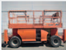
V19900 - JLG 3394RT - 2006 Diesel 4x4 - 12,06 Mtr. - 2507 Hrs. € 12.950