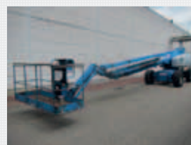
V22446 - Genie S125 - 2005 Diesel 4x4 - 40,15 Mtr. - 3588 Hrs. € 52.500