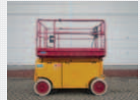
V20407 - Iteco IT12151 - 2007 Electric - 13,9 Mtr. - 583 Hrs. € 8.950