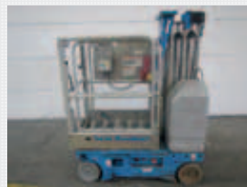
V21559 - Genie GR15 - 2004 Electric - 6,35 Mtr. - 494 Hrs. € 3.250