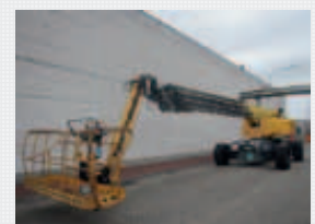
V21839 - Haulotte H43TPX - 2007 Diesel 4x4 - 43 Mtr. - 3836 Hrs. € 57.500