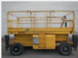
V21106 - Haulotte H12SX - 2007 Diesel 4x4 - 12 Mtr. - 1132 Hrs. € 11.950