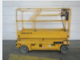
V21029 - Haulotte Compact 8 - 2007 Electric - 8,2 Mtr. - 815 Hrs. € 3.950