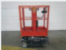
J22338 - Braviisol Lui Mini HD - 2014 Electric - 4,9 Mtr. - 50 Hrs. € 6.750