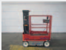
V19948 - Skyjack SJ12 - 2010 Electric - 5,65 Mtr. - 144 Hrs. € 3.650