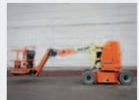
J22167 - JLG E300AJP - 2014 Electric - 11,14 Mtr. - / Hrs. € 34.950