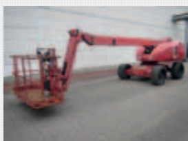
V21806 - Haulotte H16TPX - 2006 Diesel 4x4 - 15,44 Mtr. - 2590 Hrs. € 11.950