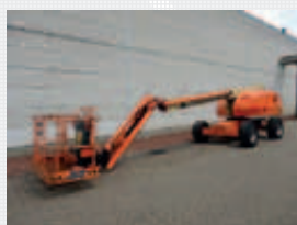
V19636 - JLG 460SJ - 2008 Diesel 4x4 - 16,02 Mtr. - 3241 Hrs. € 17.950