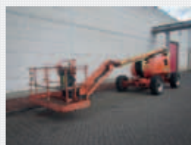
V19157 - JLG 600AJ - 2011 Diesel 4x4 - 20,29 Mtr. - 2343 Hrs. € 37.500