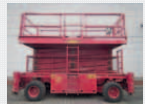
V22086 - Hollandlift B-195DL25 - 2007 Diesel 4x4 - 21,5 Mtr. - 3808 Hrs. € 29.500