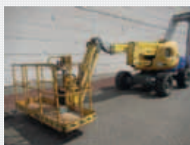
V21122 - Haulotte HA16SPX - 2007 Diesel 4x4 - 16 Mtr. - 4109 Hrs. € 14.500