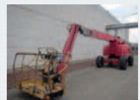
V21913 - Haulotte HA260PX - 2006 Diesel 4x4 - 25,6 Mtr. - 3685 Hrs. € 27.500