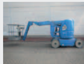
V22471 - Manitou 120AETJC - 2006 Electric - 11,95 Mtr. - 1493 Hrs. € 13.950