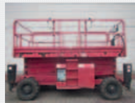
V21782 - Haulotte H15SX - 2007 Diesel 4x4 - 15 Mtr. - 2374 Hrs. € 11.950