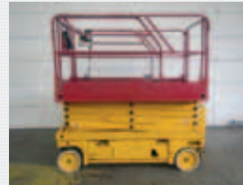
V20379 - Haulotte Compact 12 - 2007 Electric - 12 Mtr. - 775 Hrs. € 5.950