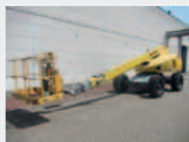
V21818 - Haulotte H21TX - 2007 Diesel 4x4 - 20,8 Mtr. - 2037 Hrs. € 15.950