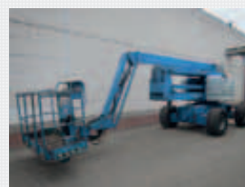
V22356 - Genie Z60-34RT - 2006 Diesel 4x4 - 20,3 Mtr. - 5086 Hrs. € 24.500