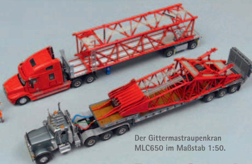
Der Gittermastraupenkran MLC650 im Maßstab 1:50.

Das Modell lässt sich auch in Einzelteilen auf Transporter präsentieren