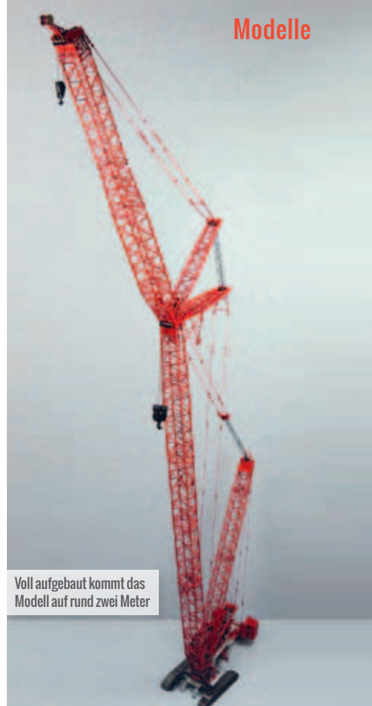
Voll aufgebaut kommt das Modell auf rund zwei Meter