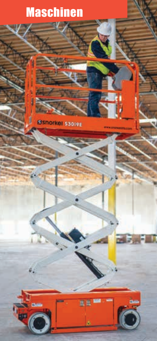
Clou an Snorkels S3019E: Das Scherenpaket versinkt eingefahren vollends im Chassis