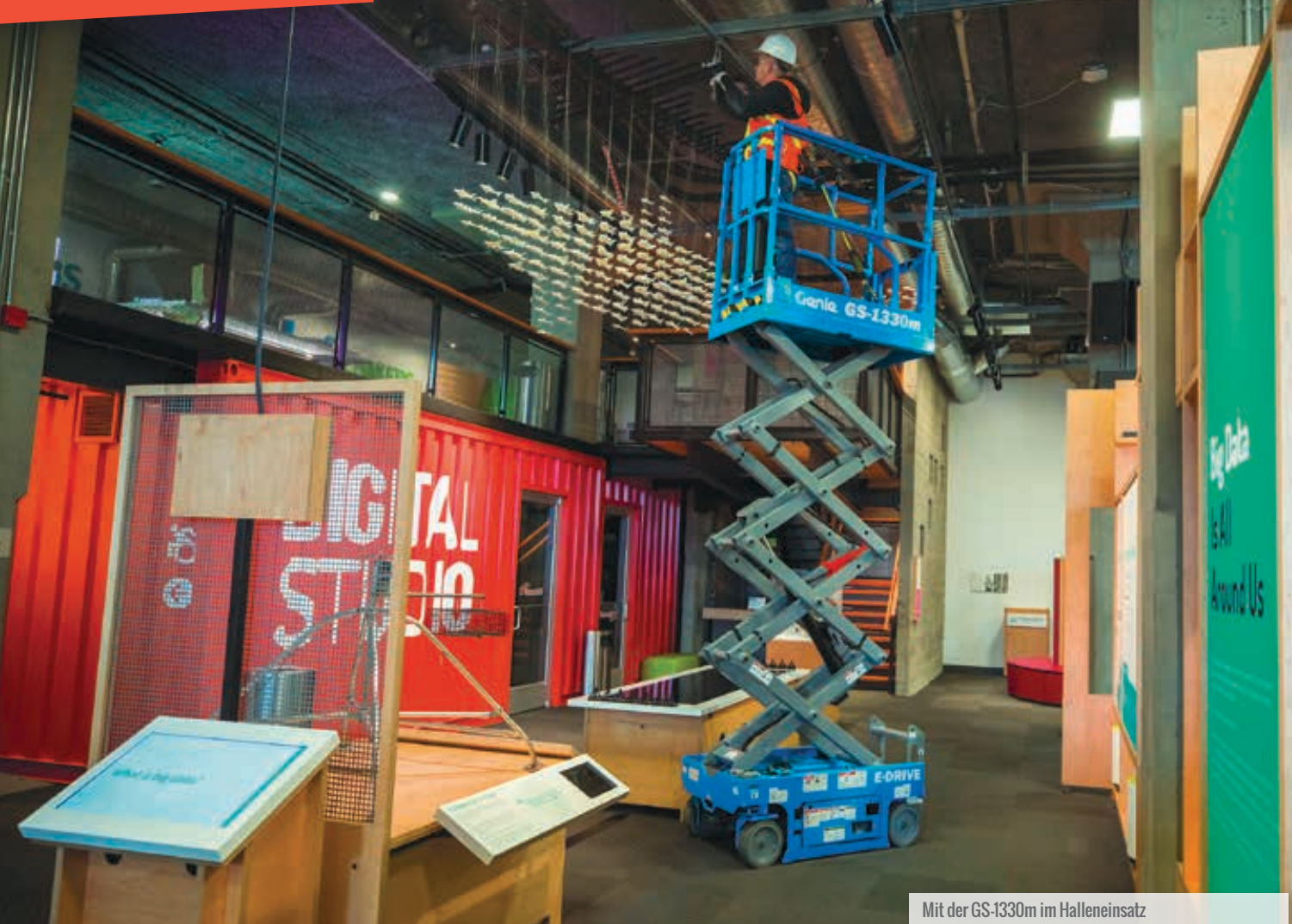
Mit der GS-1330m im Halleneinsatz