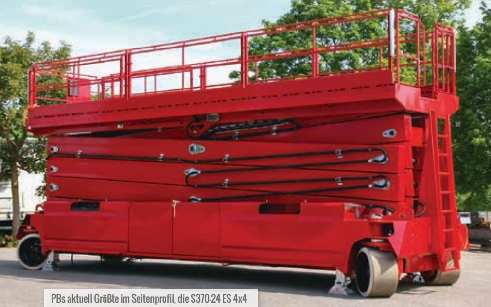
PBs aktuell GröÙte im Seitenprofil, die S370-24 ES 4x4