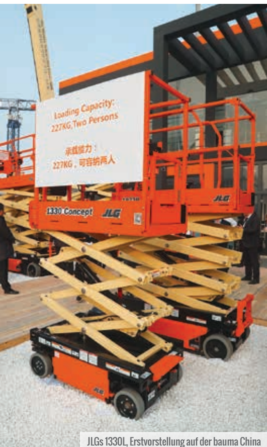
JLGs 1330L, Erstvorstellung auf der bauma China