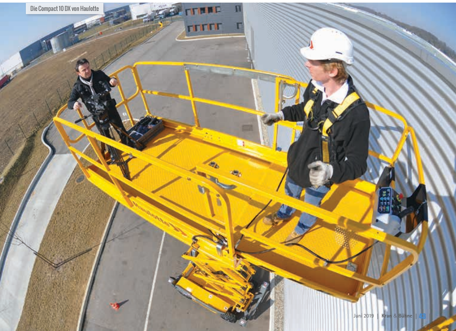
Die Compact 10 DX von Haulotte