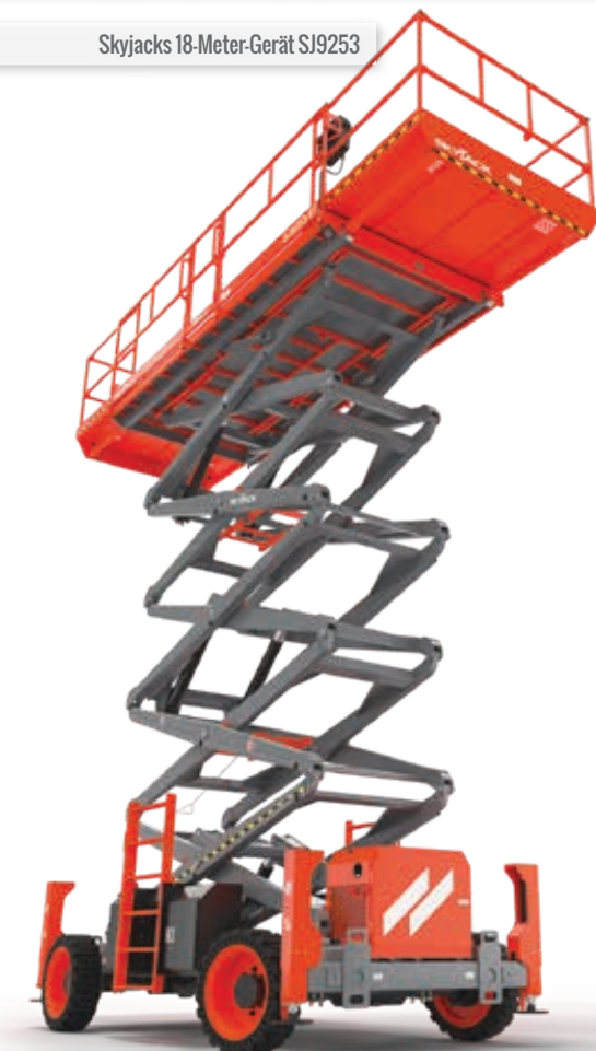
Skyjacks 18-Meter-Gerät SJ9253