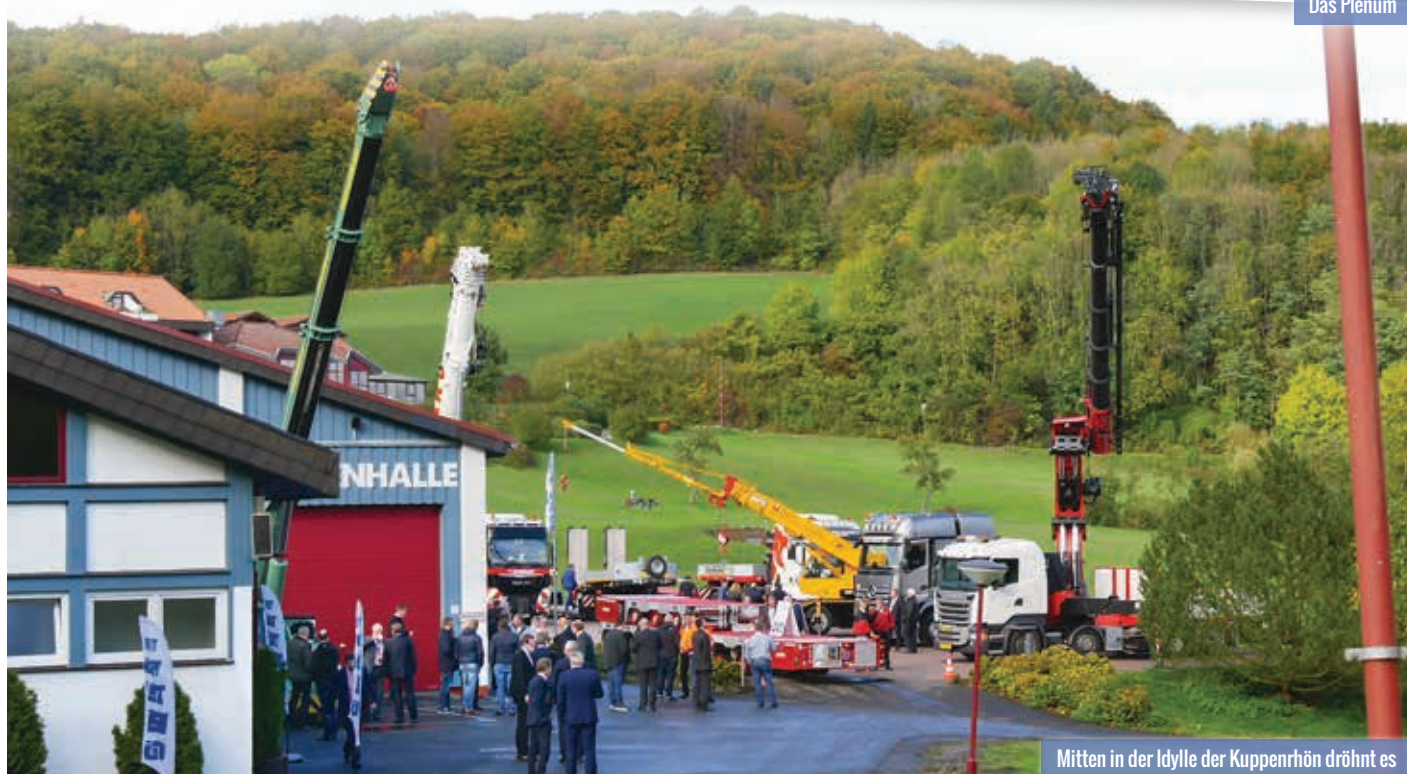
Mitten in der Idylle der Kuppenhön dröhnt es

Was hier gezeigt wird, ist kaum an einem anderen Ort zu sehen. Über was hier gesprochen wird, hat Gewicht – und das im wahren Sinn des Wortes. Auf der internationalen Schwerlasttagung geht es um Einsätze der Superlative. Hier kann man anhand von Einsatzbeispielen neue Anregungen erhalten, wie mancher Job vielleicht zu handhaben wäre. Hier treffen sich sehr viele Experten aus der Schwerlastbranche sowie etliche Hersteller passender Komponenten und nutzen die zwei Tage zum regen Austausch. Die Internationalen Schwerlasttage finden am Freitag, den 13. September und am Samstag, den 14. September 2019 statt.