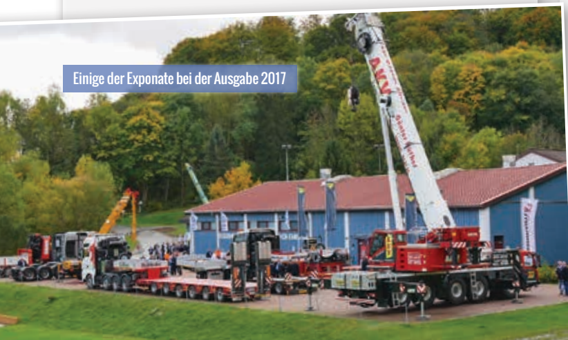
Einige der Exponate bei der Ausgabe 2017