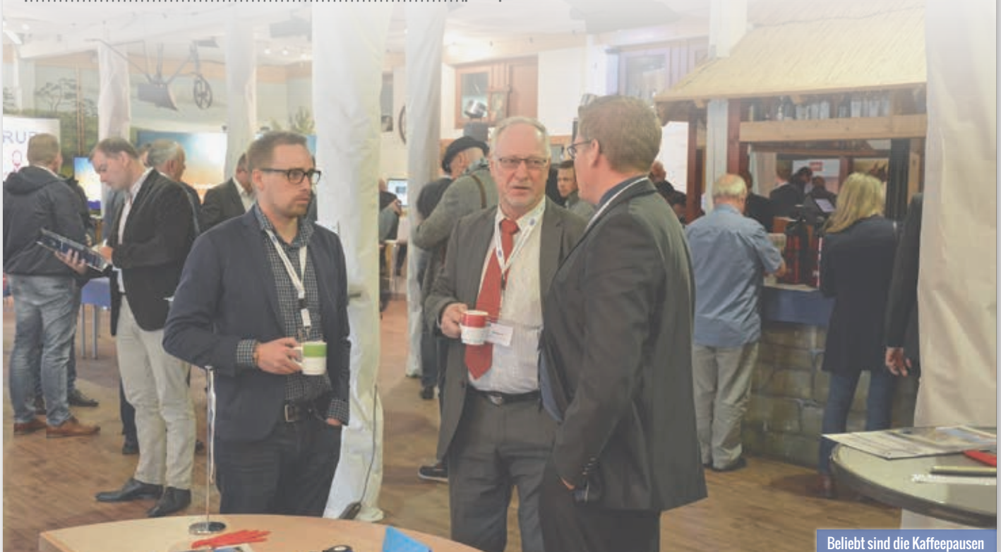
Beliebt sind die Kaffeepausen