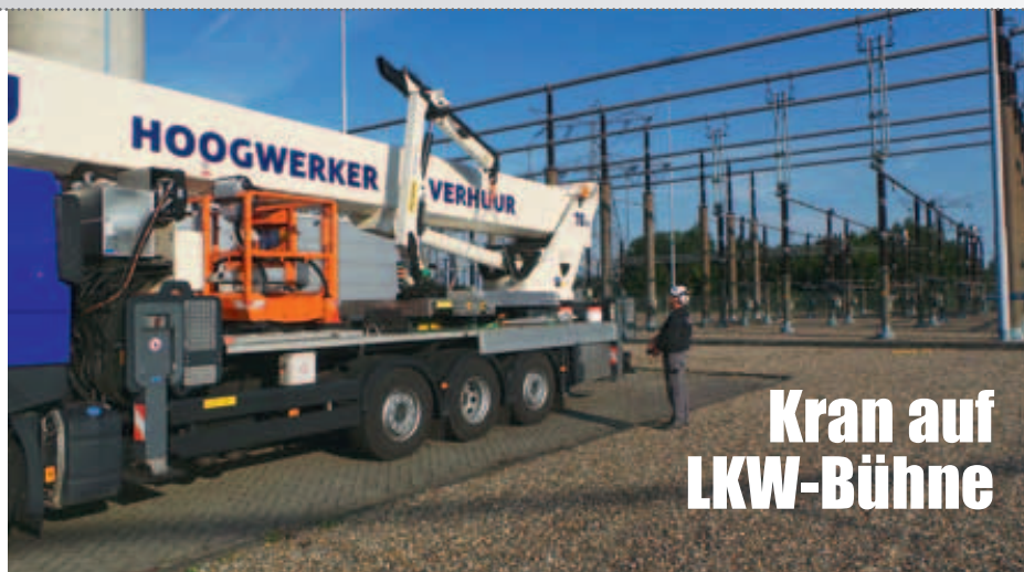
Kran auf LKW-Bühne

Debru Hoogwerk aus den Niederlanden hat sich etwas Neues einfallen lassen – zum Dauerthema Unterlegplatten. Und zwar haben die findigen Holländer einfach einen kleinen Ladekran vom Typ Palfinger PK 5.501 SLD5 auf das Chassis der 70-Meter-LKW-Bühne montiert. Der Kran mit einem Lastmoment von 5,1 mt verfügt über eine maximale Hubkraft von 3,3 Tonnen und erzielt Reichweiten von 11,1 Metern (hydraulisch) sowie 12,7 Metern (mechanisch). Damit kann der Bediener die Abstützplatten einfach per Fernsteuerung ein- und ausheben.