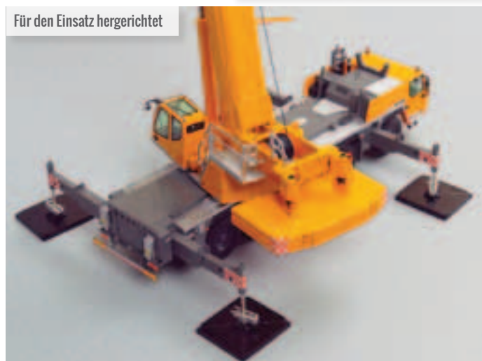
Für den Einsatz hergerichtet

Ausgeführt im Maßstab 1:50, wird der Mobilkran von NZG hergestellt. Wie vom Unternehmen gewohnt, wird das Modell in einer Liebherr-Markenbox geliefert. Dazu liegt eine farbige Bedienungsanleitung bei, welche die Montage und die wichtigsten Funktionen beschreibt. Holt man das Modell aus seiner Schachtel und hält es in der Hand, merkt man den hohen Metallgehalt, denn es ist schwer. Das Chassis zeigt viele Details, ist mit schönen Rädern ausgestattet und jede Achse kann unabhängig bewegt werden. Es hat auch eine gute Achsaufhängung, die dem Modell eine gute Bewegungsfreiheit bietet. Die Fahrerkabine ist gleichfalls mit etlichen Details bestückt. Allerdings ist die Hakenblock-Aufhängung vorne sehr massiv, wodurch es schwieriger wird, das Modell im Transportmodus mit einem Haken zu versehen. Eine nette Geste sind die weichen Gummiröcke, die über den Radhäusern sitzen. Die Stützen können zweistufig ausgefahren werden: Auch hier fällt der Detailreichtum auf.