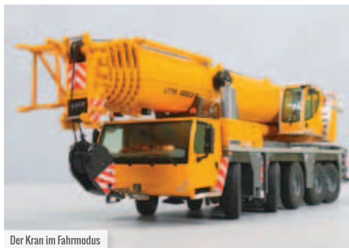
Der Kran im Fahrmodus