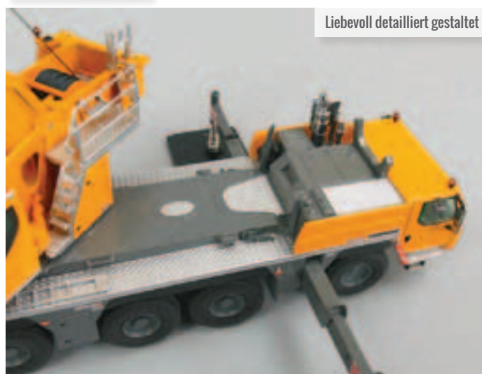
Liebevoll detailliert gestaltet