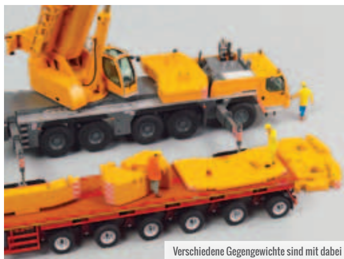
Verschiedene Gegengewichte sind mit dabei