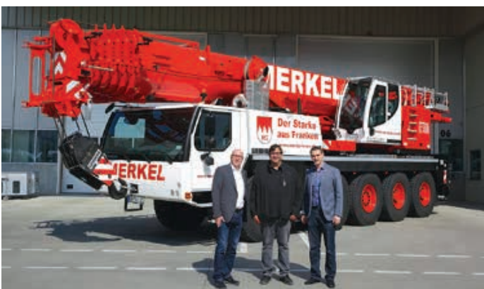
Einen neuen LTM 1100-5.2 hat Merkel Krane aus Bamberg in seinem Fuhrpark. Der Kran ist mit zweiter Winde, Montagespitze, Doppelklappspitze und einer Kamera am Auslegerkopf ausgestattet. <<