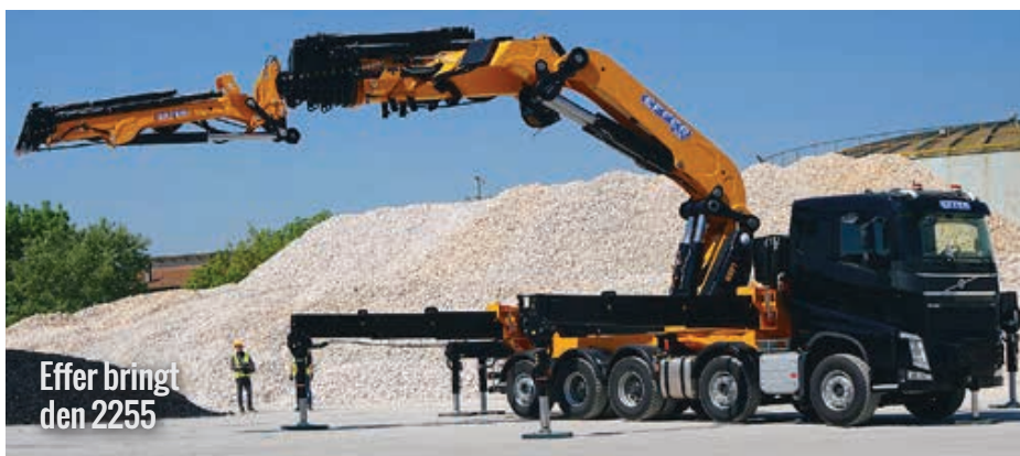
Effer bringt den 2255

Effer hat ein neues „Flaggschiff“, den 2255. Das Besondere: Der Ladekran mit eigentlich acht Ausschüben kann mittels des „KJ“, wie Effer seine Entwicklung bezeichnet, um zwei Ausschübe verlängert werden. Damit kann mehr Reichweite oder ein höherer Gelenkpunkt erzielt werden. Das „KJ“ lässt sich an den Hauptausleger montieren und bietet so mehr Meter zur Seite oder in die Höhe, was für den 2255 eine maximale Reichweite von 35 Meter bedeutet. <<