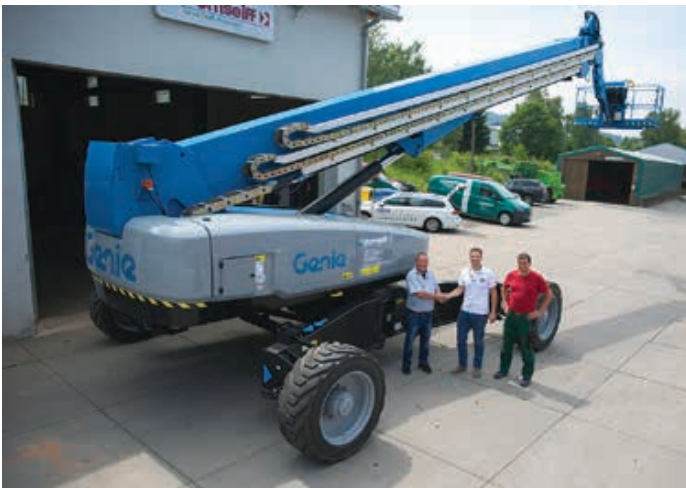
Dornseiff hat jetzt auch Genies höchste Teleskoparbeitsbühne SX-180 im Angebot. Das 57-Meter-Gerät ergänzt den 235 Maschinen umfassenden Fuhrpark. <<