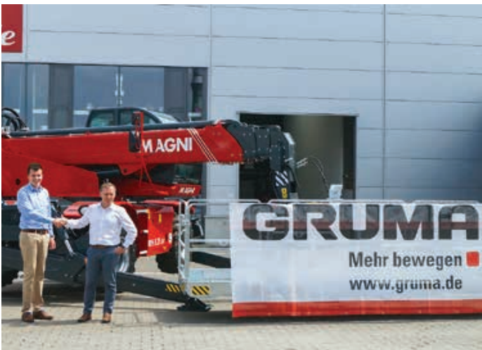
Gruma Nutzfahrzeuge erweitert seinen Mietpark um neun Magni-Modelle der Serie RTH 4.18 mit einer Traglast von vier Tonnen und einer Hubhöhe von 18 Metern sowie der drehbaren Serie 6.30 SH mit sechs Tonnen Traglast und 30 Metern Hubhöhe. Hinzu kommen ein starrer TH 6.20 und mehrere Elektroscheren mit Arbeitshöhen zwischen sechs und 14 Metern. Mit dabei: der 2.000 Telesapler, der bei Magni vom Band lief. <<