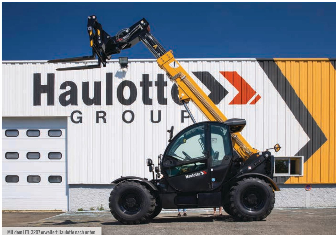
Mit dem HTL 3207 erweitert Haulotte nach unten

Hubhöhen zwischen sechs und 35 Metern und Traglasten von 2,7 bis maximal 12 Tonnen. Die Italiener produzieren seit letztem Jahr all ihre Teleskoplader nach einem modularen Konzept. Die im Bauwesen und bei Vermietern seit mehreren Jahrzehnten vertretenen Klassiker der Roto- und Panoramic-Serien sind 2019 im neuen Design erschienen. „Sie werden im Markt gut angenommen“, berichtet Henrich Clewing, Geschäftsführer Merlo Deutschland. Im vergangenen Jahr hat das Unternehmen außerdem das kompakte vollelektrische Konzept „E-Worker“ mit 2,5 Tonnen/5 Metern vorgestellt, und zwar in zwei Varianten: einmal als 25.5-60 mit Zweiradantrieb und 44kW, einmal als 25.5-90 mit Allradantrieb und 66kW Leistung. Die maximale Reichweite nach vorne beträgt 2,6 Meter bei einer Last von einer Tonne. Das Batteriepaket reicht für einen 8-Stunden-Arbeitstag. Nach einem historischen Geschäftsjahr 2019 mit einem Umsatzplus von sieben Prozent