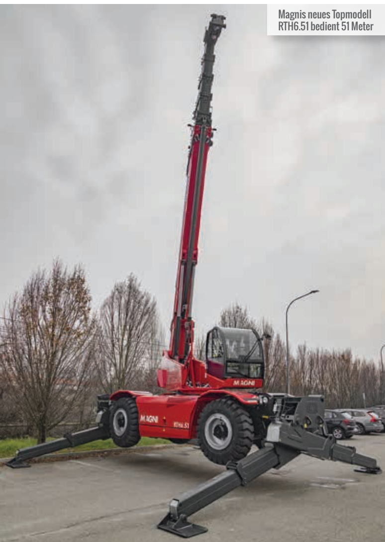
Magnis neues Topmodell RTH6.51 bedient 51 Meter