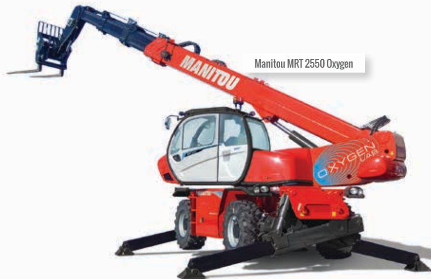
Manitou MRT 2550 Oxygen