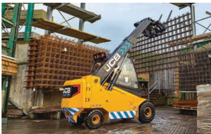
Der Teletruk 30-19E ist das erste elektrische Modell von JCB in diesem Segment

Er basiert auf dem 626-Standardmodell mit sechs Metern Hubhöhe, 2,6 Tonnen Kapazität und einer maximalen Reichweite von 3,1 Metern bei 900 Kilogramm und teilt die meisten seiner Komponenten wie auch die Struktur mit dem regulären Dieselgerät. Die Stromversorgung erfolgt über eine Standard-Lithium-Batterie mit 80 Volt und 300 Ah, wobei auch ein größerer Akku mit 400 Ah zu haben ist. Die Standardbatterie soll drei Stunden Dauerbetrieb oder sechs Stunden „typische Nutzung“ ermöglichen, der größere Akku vier beziehungsweise acht Stunden. Mit einem Schnellladegerät ist der Akku in zwei Stunden auf hundert Prozent aufgeladen, während es vier Stunden mit einem Standard-Ladegerät dauert. Das Wiederaufladen des 400 Ah-Akkus dauert laut Faresin etwa ein Drittel bis ein Viertel länger.