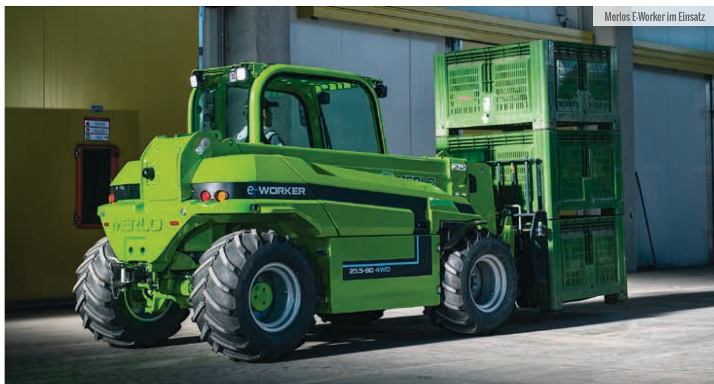
Merlos E-Worker im Einsatz

In den vergangenen ein, zwei Jahren wurde bei den Herstellern viel über batterieelektrische Teleskoplader gesprochen. Der Druck, solche Maschinen zu entwickeln, kommt von der wachsenden Zahl von Auftragnehmern, die ihren CO 2 -Fußabdruck senken wollen. >>