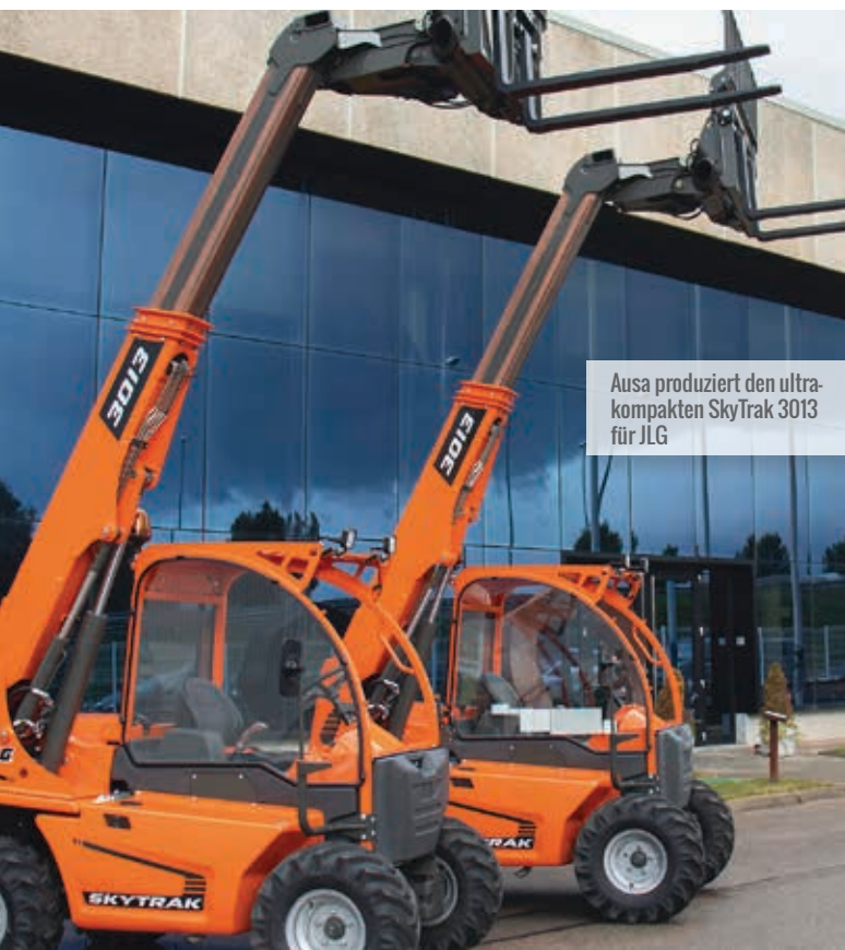
Ausa produziert den ultrakompakten SkyTrak 3013 für JLG