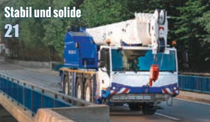
21 Stabil und solide