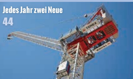
44 Jedes Jahr zwei Neue