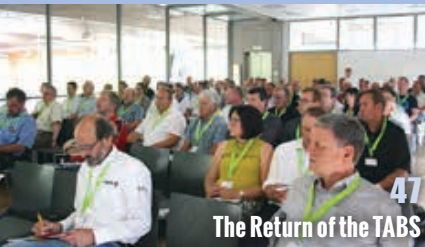
47 The Return of the TABS