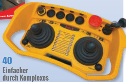
40 Einfacher durch Komplexes

Genies 8-Meter-Schere GS-1930 in der Lagerlogistik 27