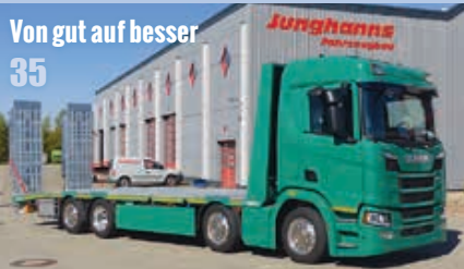
35 Von gut auf besser