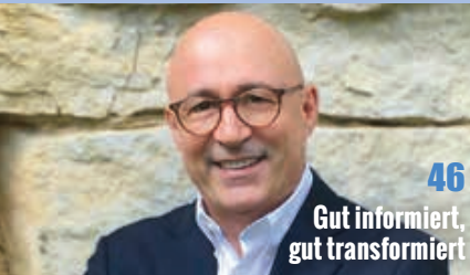
46 Gut informiert, gut transformiert