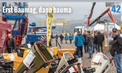
42 Erst Baumag, dann bauma