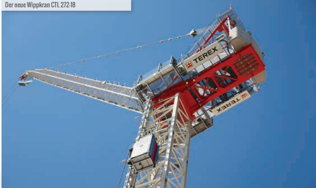
Der neue Wippkran CTL 272-18

Präzision bei der Platzierung schwererer Objekte gewählt werden kann. Seine Autonivellierung hält die Hakenflasche zudem beim Verstellen der Wippauslegerneigung automatisch auf derselben Höhe. Apropos Höhe: Freistehend kann der CTL 272-18 bis 84,4 Meter aufgebaut werden, und zwar mit Turmstücken aus den Serien H20 (1,9 Meter), HD23 (2,3 Meter) und TS212 (2,37 Meter). Der Wippkran verfügt auch über eine neue „S-Pace“-Kabine mit integrierter Klimaanlage und Heizung, verstellbaren Sitzen und guter Rundumsicht. Die Seitenfenster lassen sich – im Falle eines Bruchs – von innen wechseln. Und der Wipper ist ebenso für den Einbau und die Einrichtung eines Zoning- und Antikollisionssystems samt Kameras vorbereitet.