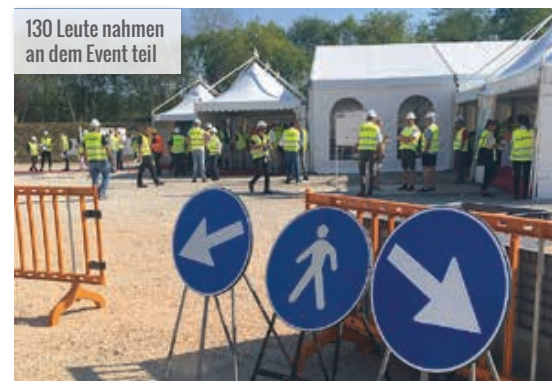
130 Leute nahmen an dem Event teil