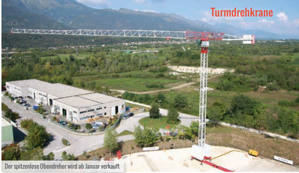
Der spitzenlose Obendreher wird ab Januar verkauft