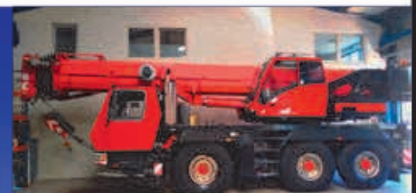
55 t, Grove GMK 3055, 2007