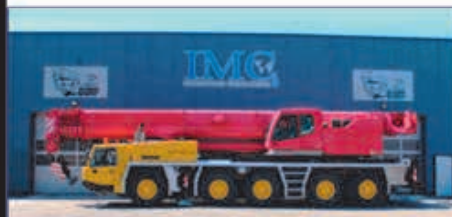
160 t, Faun ATF 160G-5, 2006

Email: mail@imc-cranes.com | Web: www.imc-cranes.com