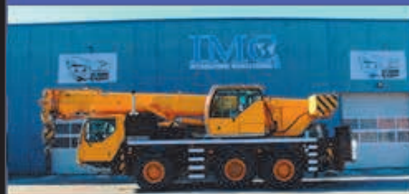
45 t, Liebherr LTM 1045-3.1, 2008