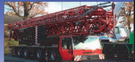
8 t, Liebherr MK 80, 2008

Wir sind umgezogen, bitte beachten Sie ab sofort unsere neue Adresse: