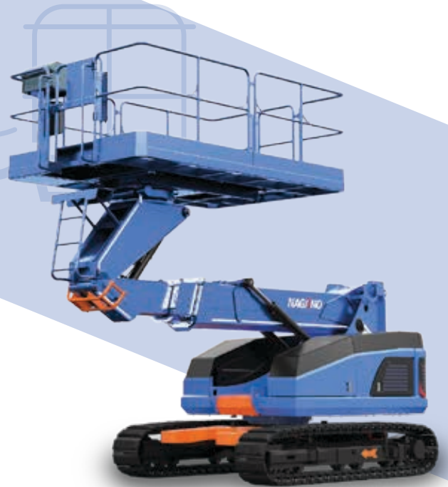
Z11Auj Teleskop-Arbeitsbühne mit extra großer Plattform 11m