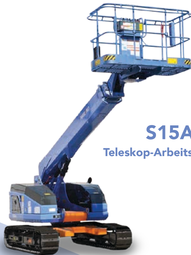
S15Auj Teleskop-Arbeitsbühne 15m