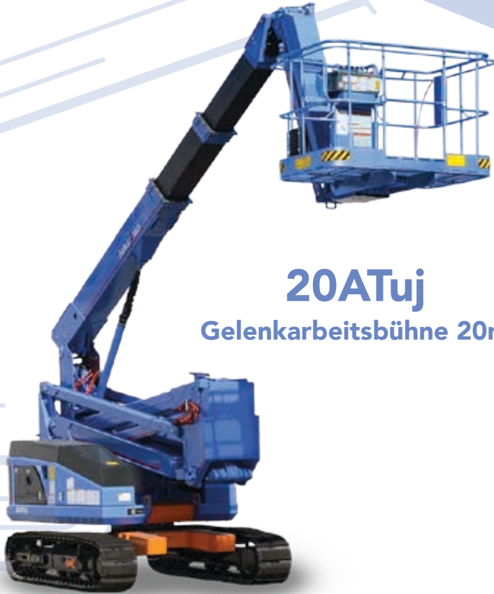
20ATuj Gelenkarbeitsbühne 20m