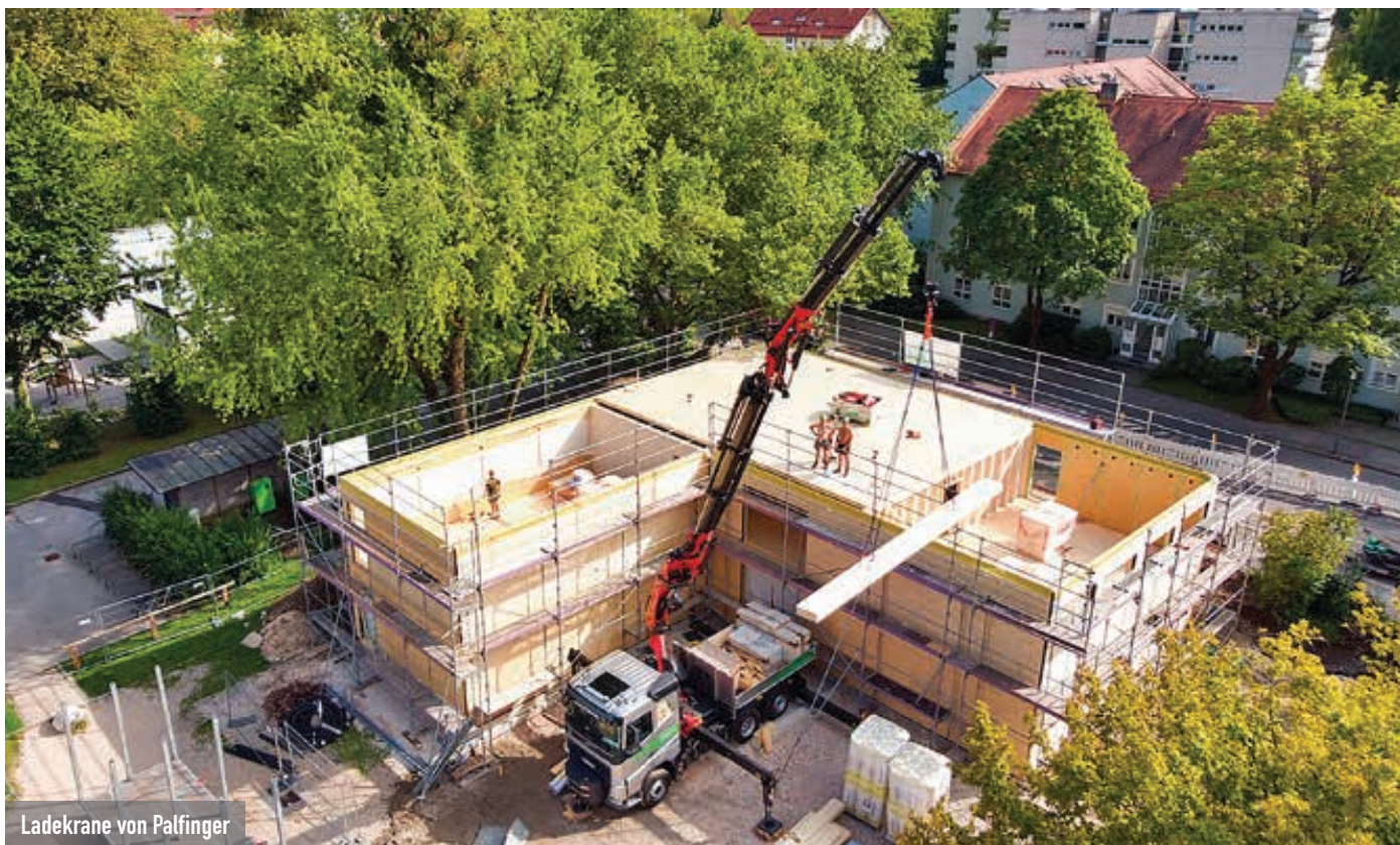
Ladekrane von Palfinger

Bekannt für seine Raupenbühnen ist Teupen. In Köln hat das Gronauer Unternehmen eine Leo 18GTplus dabei. Die Bühne bietet eine Arbeitshöhe von bis zu 18,30 Meter, eine seitliche Reichweite von bis zu 8,50 Meter und einen Gelenkpunkt bei 8,30 Meter. Zur Standardausstattung gehört eine Funkfernsteuerung.