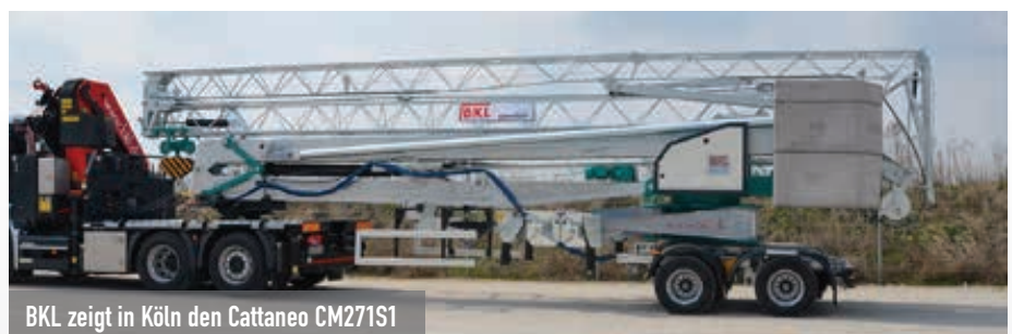
BKL zeigt in Köln den Cattaneo CM271S1