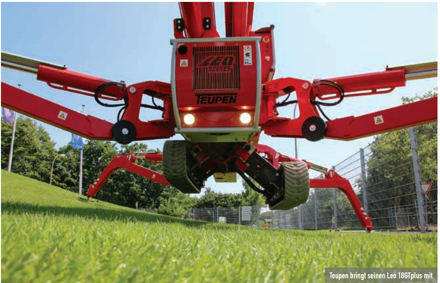
Teupen bringt seinen Leo 18GTplus mit