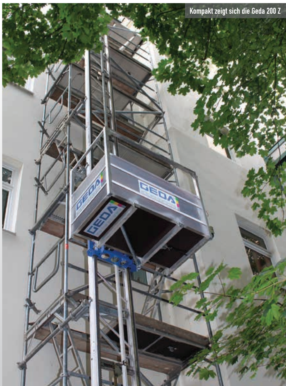
Kompakt zeigt sich die Geda 200 Z

Mit der Baureihe „Cattaneo“ führt BKL seit einigen Jahren Untendreher für den Dachdeckerbereich im Programm. Auf der Messe wird das Modell CM271S1 gezeigt. Es ist der meistverkaufte aus dem BKL-System. Mit 27 Metern maximaler Ausladung, 2,5 Tonnen maximaler Traglast und Straßenfahrwerk ist der CM 271S1 gerade auf Kurzzeitbaustellen einfach zu handhaben.