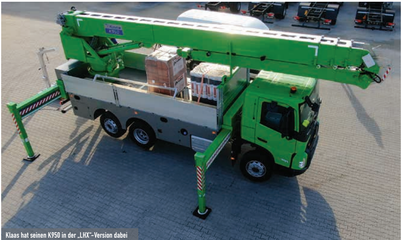
Klaas hat seinen K950 in der „LHX“-Version dabei

Aus seinem reichhaltigen Angebot an Lade- und Montagekränen hat Palfinger ein Sortiment für die Messe erstellt. Für sicheres und ruckfreies Arbeiten setzt das Unternehmen bereits seit längerem auf sein Schwingungsdämpfungssystem AOS.