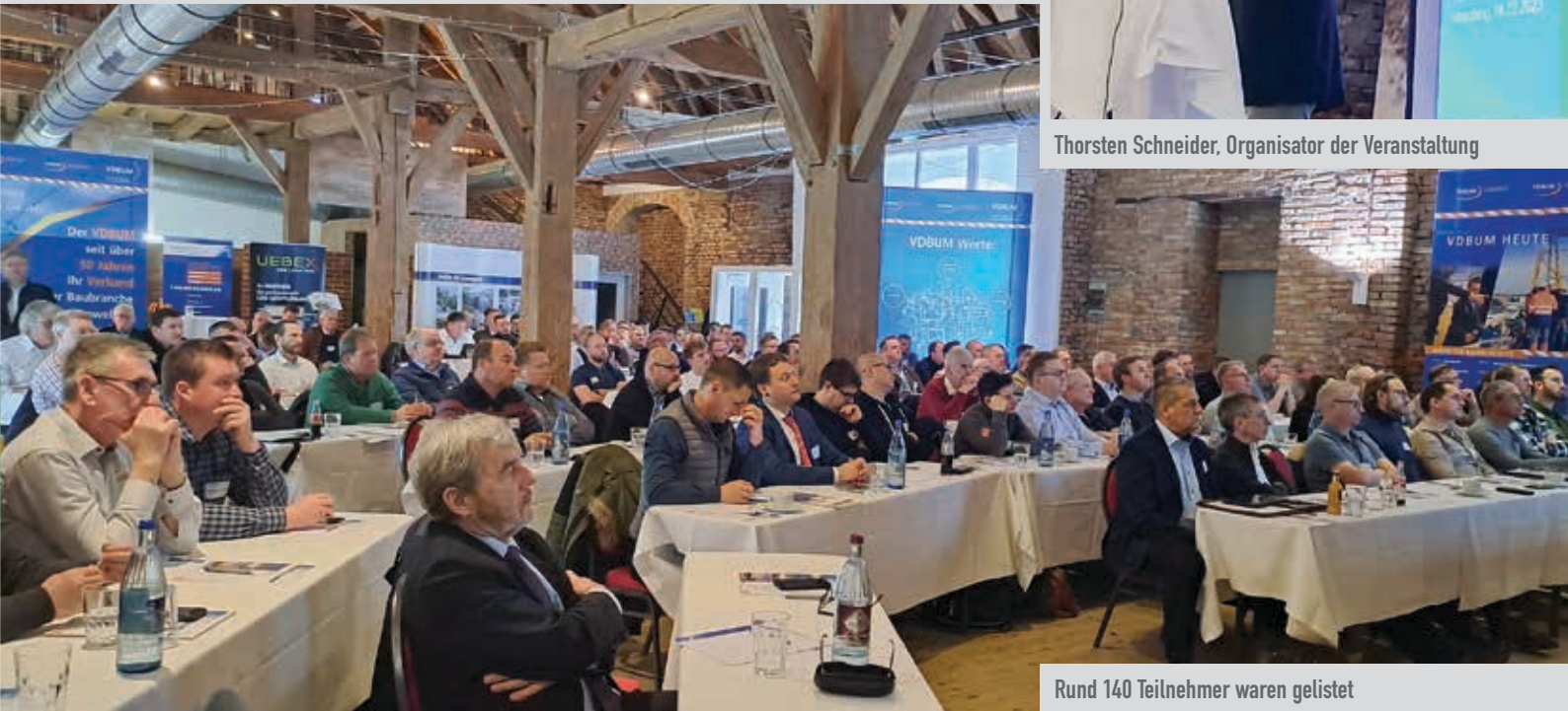
Rund 140 Teilnehmer waren gelistet

Der VDBUM hat zum Turmdrehkran-Branchentreff geladen und stieß auf großes Interesse. Eindrücke von Rüdiger Kopf.