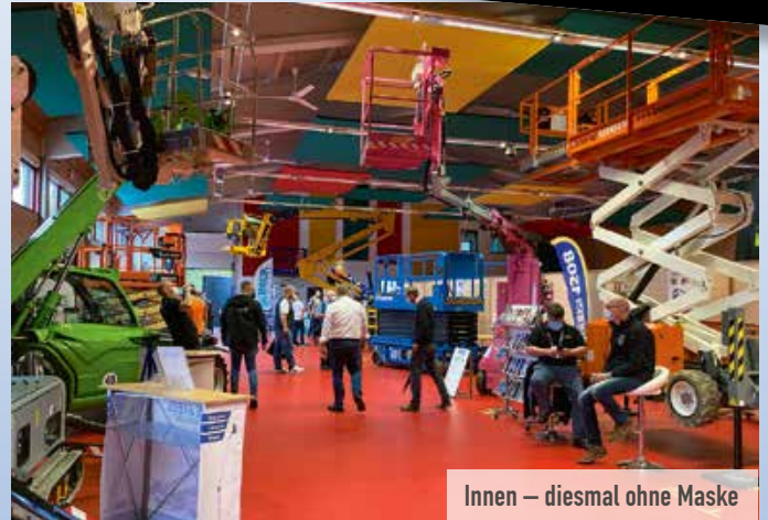
Innen – diesmal ohne Maske

Die fünften Innovationstage der Höhenzugangstechnik steigen am 16. und 17. Mai 2023 im Hessen Hotelpark Hohenroda. Es ist das dritte Mal, dass sie in Hohenroda stattfinden. Die Abendveranstaltung startet am Dienstag um 19 Uhr. Am Dienstag läuft die lockere Fachmesse von 9 bis 18 Uhr, am Mittwoch von 9 bis 15 Uhr.