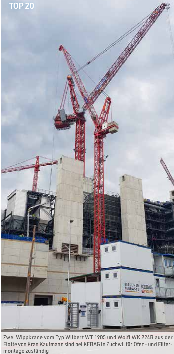
Zwei Wippkrane vom Typ Wilbert WT 1905 und Wolff WK 224B aus der Flotte von Kran Kaufmann sind bei KEBAG in Zuchwil für Ofen- und Filtermontage zuständig