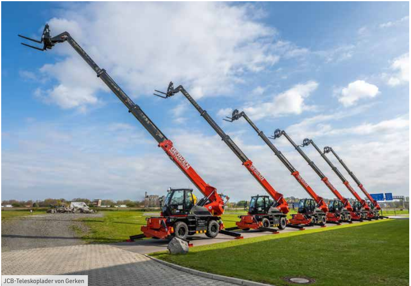
JCB-Teleskoplader von Gerken