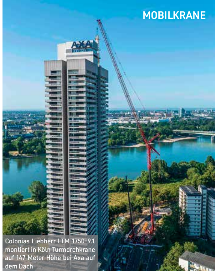
Colonias Liebherr LTM 1750-9.1 montiert in Köln Turmdrehkrane auf 147 Meter Höhe bei Axa auf dem Dach

Der Unterwagen wird von einem Mercedes-Benz Motor mit 430 kW (Euromot 5/Tier 4 final), der Oberwagen von einem Mercedes-Benz Motor mit 210 kW angetrieben. Außerdem ist der Kran mit einem Allison-Getriebe ausgestattet sowie der Megatrak -Einzelradaufhängung und integrierter Allradlenkung.