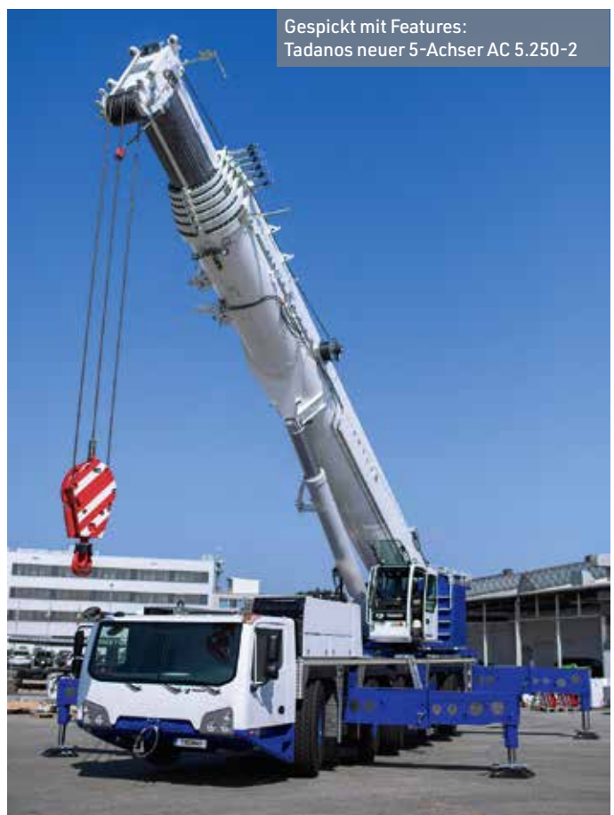
Gespickt mit Features: Tadanos neuer 5-Achser AC 5.250-2