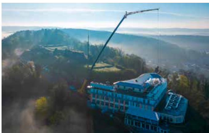
65 Meter weit bugsierte der LTM 1150-5.3 von Steil Stahlträger auf die andere Seite einer Hotelanlage in Homburg, wo der Kran binnen zwei Wochen rund 150 Hübe absolvierte