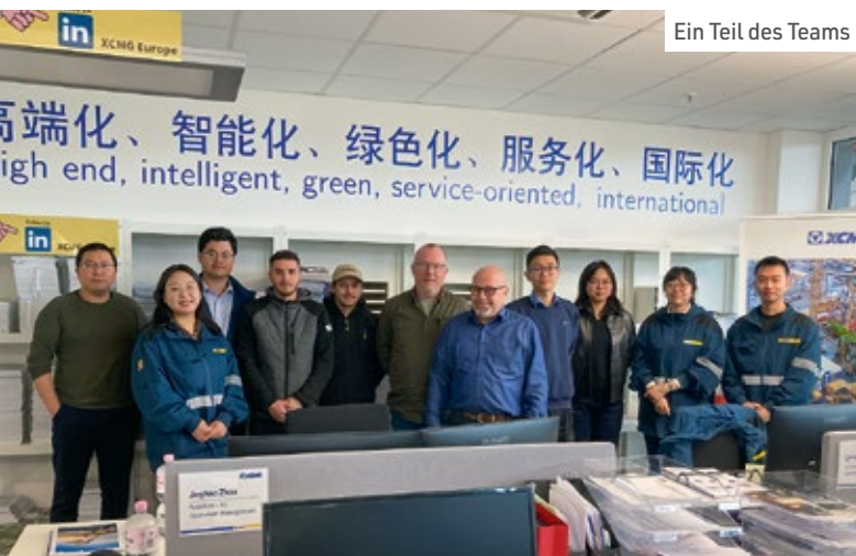
Ein Teil des Teams

Zuletzt hat XCMG 7,5 Milliarden Euro umgesetzt und seinen Exportanteil erstmals auf 45 Prozent hochgeschraubt. In kurzer Zeit dürfte mehr als die Hälfte auf das internationale Geschäft entfallen. Der DACH- und der europäische Markt werden, so viel ist zu erwarten, sicherlich ihren Teil dazu beitragen. ■