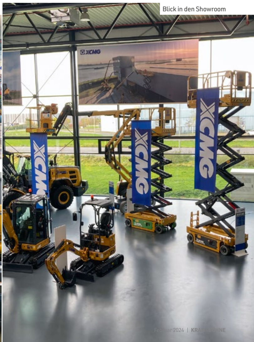
Blick in den Showroom