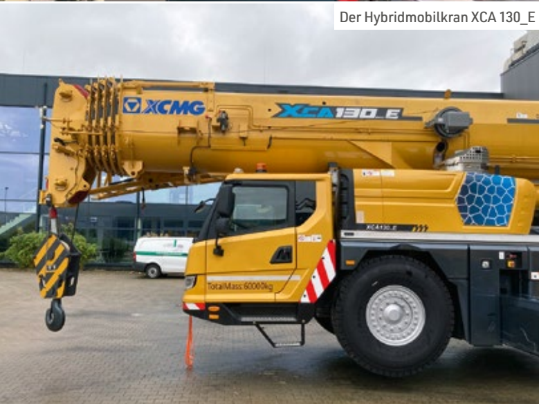
Der Hybridmobilkran XCA 130_E