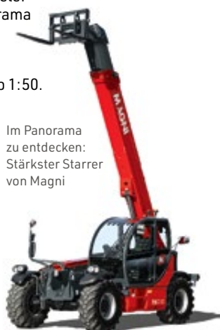
Im Panorama zu entdecken: Stärkster Starrer von Magni