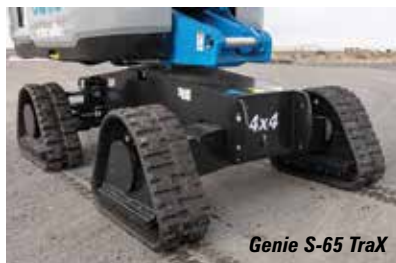
Genie S-65 Trax

We will start the tour in External area 5 with Genie which will show its new Trax systems for four of its boom lifts - the 62ft Z-62/40 and 80ft S-80 J telescopic, and the 45ft S-45 XC and 65ft S-65 XC 'Xtra Capacity' telescopics.