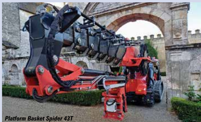
Platform Basket Spider 43T