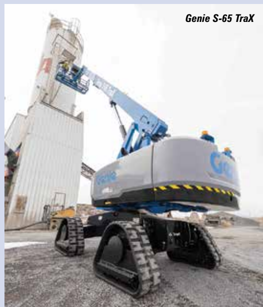
Genie S-65 Trax

Le nouveau système est plus simple, plus facile d'entretien permet