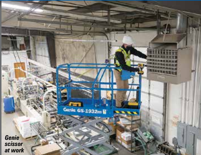
Genie scissor at work