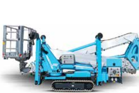
Multitel SMX-210 Axon

diesel hybrid. Also check the 25 metre Ragno TZX 250 Eco - a super silent battery powered model and ask about the record breaking 58 metre model. Next stop Platform Basket where we might see the new 54 metre Spider 54T telescopic on show. Also expect to see its new tracked carriers and cranes. We now head to Zoomlion which launched the 27 metre twin telescopic boom ZX27AE with lithium ion battery power just over a year ago. Finally, we head to Versalift which just may have a Bluelift on display, while the CTE dealer SNM will now show spider lifts this year.