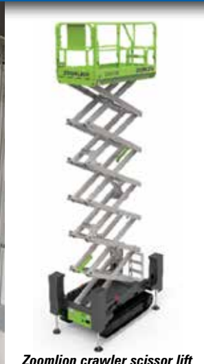
Zoomlion crawler scissor lift