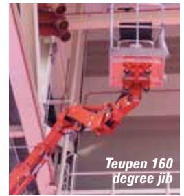
Teupen 160 degree jib