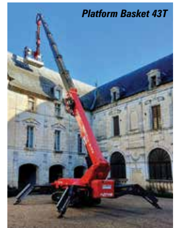
Platform Basket 43T

Les Nacelles araignées sont assez bien représentées à Intermat comparé à d'autres types d'équipement et la plupart se trouvent à l'extérieur - Zone 5. Donc nous commençons notre visite par Teupen.