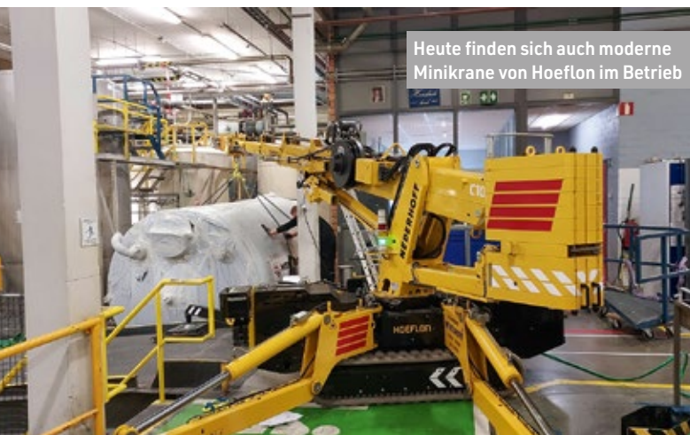
Heute finden sich auch moderne Minikrane von Hoeflon im Betrieb

Bankwesen und ist jetzt Geschäftsführer. Sie haben eine klare Vision: Man will nie der billigste Anbieter sein, sondern versucht, treue Kunden zu gewinnen, die einen fairen Preis für guten Service, solide Beratung und voll ausgestattete Krane mit erfahrenen Bedienern zahlen wollen.