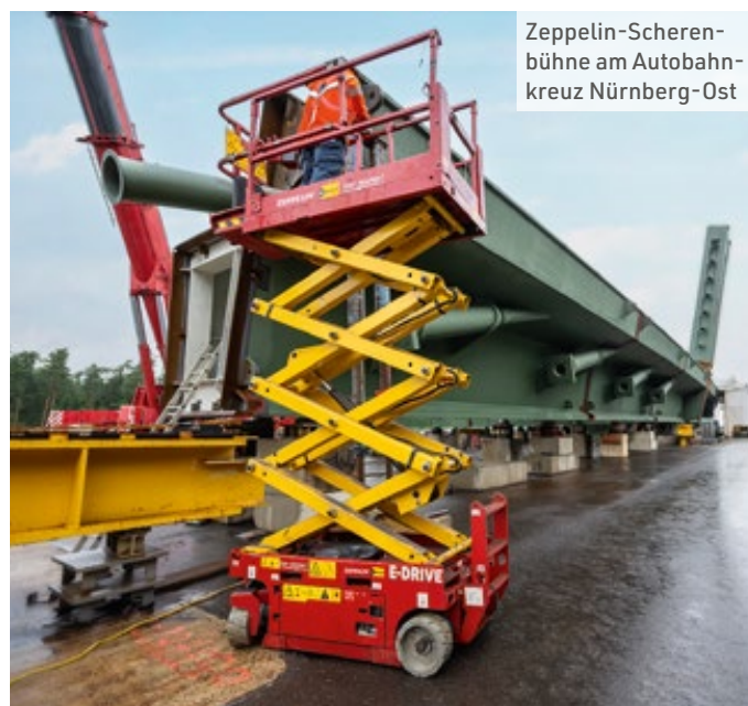
Zeppelin-Scherenbühne am Autobahnkreuz Nürnberg-Ost