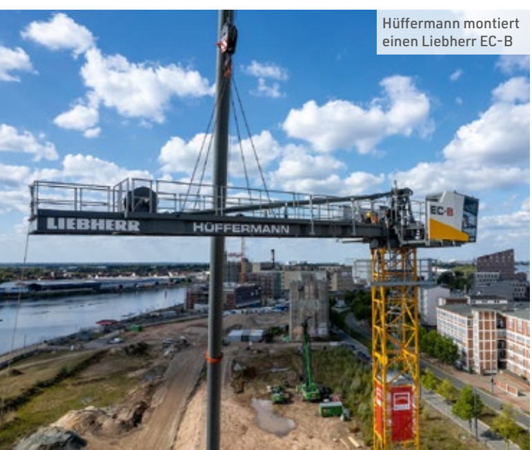
Hüffermann montiert einen Liebherr EC-B

davon aus, dass pikanterweise Gräfelting vor Wels rückt, weil Schmidbauer aufgestockt hat ... Das fühlt sich ein bisschen so an wie bei der EM weiterkommen, ohne gespielt zu haben – einfach aufgrund der Konstellation. Sagen wir diplomatisch: Schmidbauer und Felbermayr liegen von den Gesamthakenhöhen her in etwa gleichauf, Felbermayr betreibt aber deutlich mehr Krane, fast hundert Stück mehr.