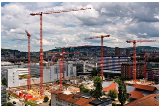
Die Kaufmann Turmkrane AG erschließt das Koch-Quartier in Zürich

Sagte da jemand gerade, dass das große Geschäft in der Schweiz gemacht wird? Ein schönes Einsatzbeispiel ist die zur Zeit größte Baustelle in Zürich, das Koch-Quartier. Hier hat der eidgenössische Krandienstleister Kaufmann auf insgesamt drei Baufeldern acht Mietkrane am Laufen, sechs von Wilbert, zwei von Wolf: drei WT260 mit