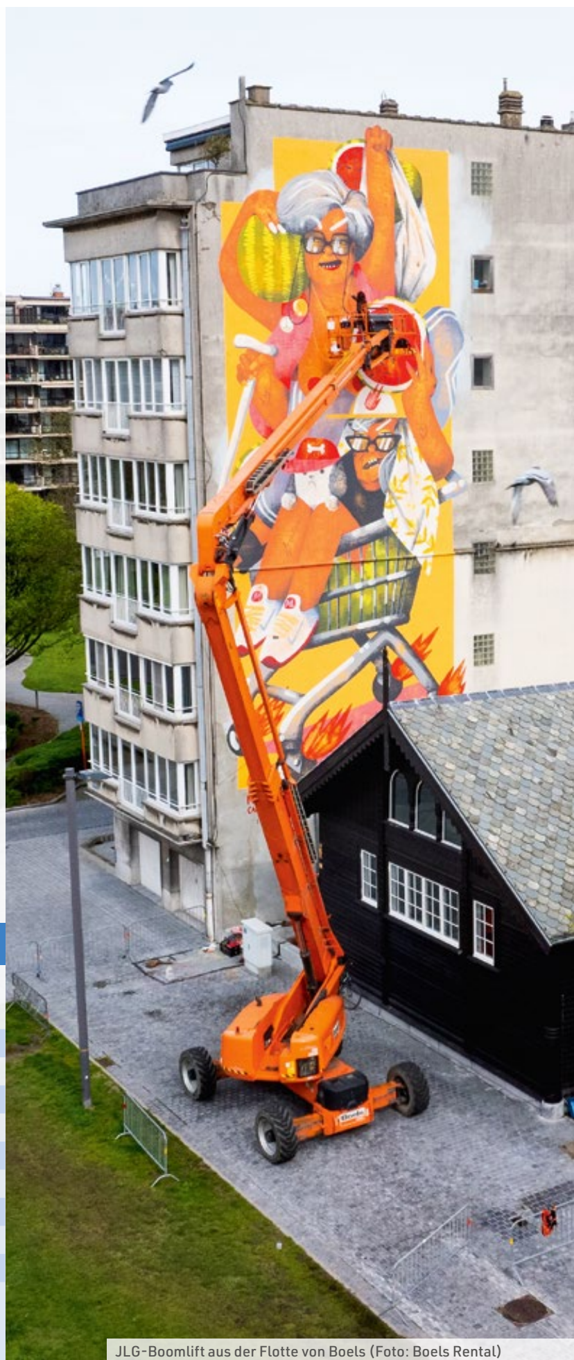
JLG-Boomlift aus der Flotte von Boels