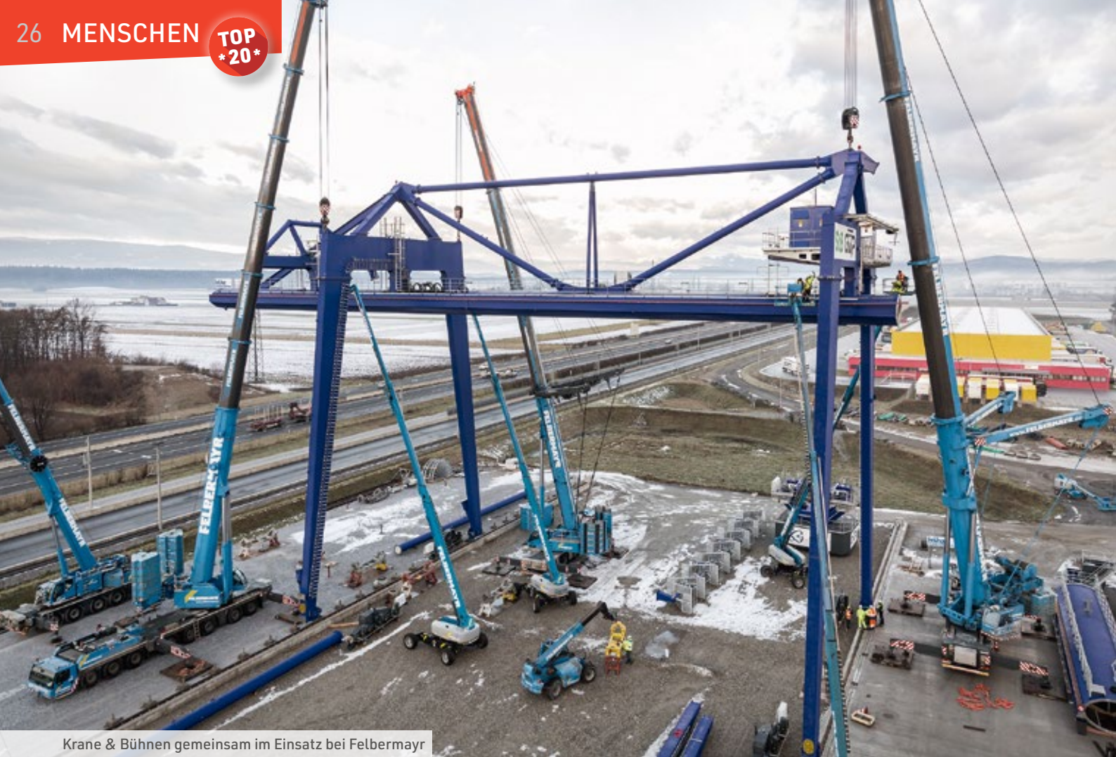
Krane & Bühnen gemeinsam im Einsatz bei Felbermayr