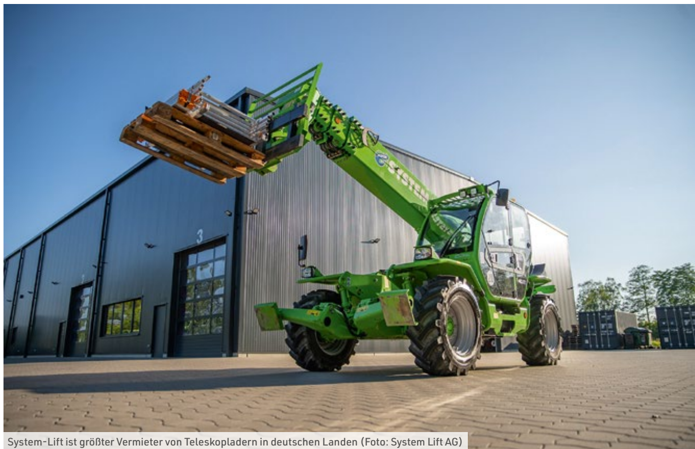
System-Lift ist größter Vermieter von Teleskoplädern in deutschen Ländern