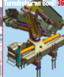
Turmdreher an Bord! 36