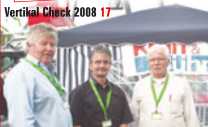
Vertikal Check 2008 17