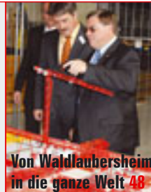
Von Waldlaubersheim in die ganze Welt 48

Titelthema Die neue HA28TJ+ ist der diesjährige Messestar von Haulotte