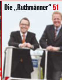
Die „Ruthmänner“ 51