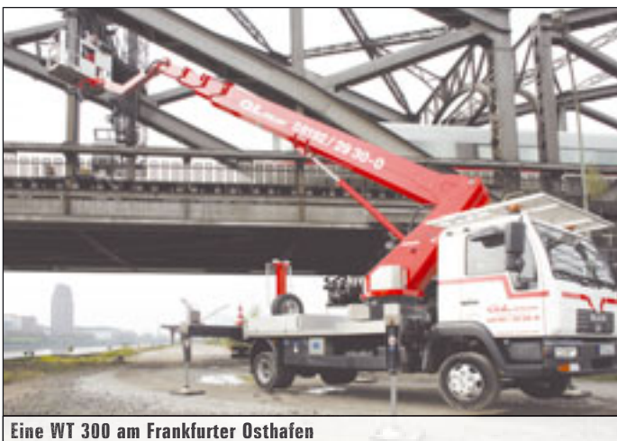
Eine WT 300 am Frankfurter Osthafen