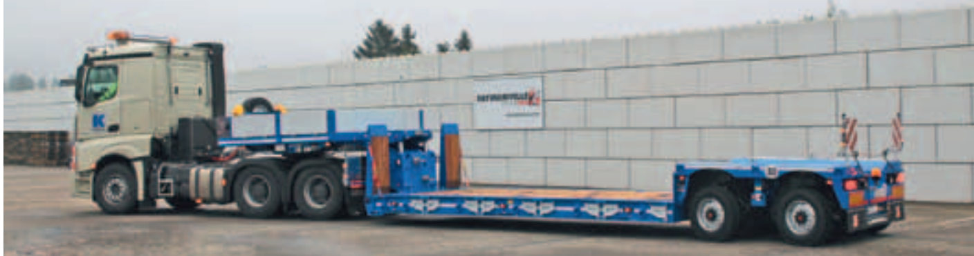
Das Familienunternehmen Karl aus Innernzell im Bayrischen Wald hat sich für einen 2-Achs-Megamax-Tiefbetauflieger von Faymonville entschieden

Den Namen Liftmaster hat Fliegl seinem Tieflader gegeben, um hervorzuheben, dass er für den Transport von Arbeitsbühnen konzipiert wurde. Der Liftmaster verfügt über seitlich verschiebbare Auffahrampen sowie abnehmbare Bordwände. Beides erleichtert das Be- und Entladen. Zur Überfahrt auf den Schwanenhals kann das Tiefbett durch einen hydraulischen Hubtisch in einem Winkel von etwa sechs Grad angehoben werden. Den gleichen Winkel hat Fliegl für das Heck konstruiert, die Ladehöhe des Tiefbetts liegt bei 900 Millimetern. Der Tieflader ist zudem nachgelenkt. Darüber hinaus werden etliche Optionen angeboten, wie zum Beispiel ein Planenaufbau. Die Nutzlast liegt bei 30 Tonnen. Dazu ist der Liftmaster mit 30 Zurrösenpaaren und einer Elektroseilwinde mit einer Zugkraft von 5,5 Tonnen ausgestattet. Neben dem Liftmaster hat Fliegl noch weitere Trailer für die Höhenzugangstechnik im Programm, darunter Plateausattel, die Kontergewichte für Krane aufnehmen und Tandemtiefbettanhänger zum Transport von Arbeitsbühnen.