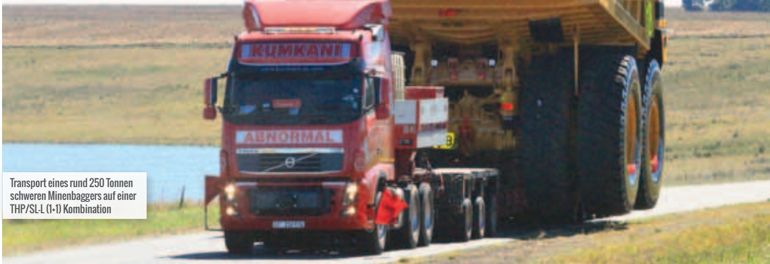
Transport eines rund 250 Tonnen schweren Minenbaggers auf einer THP/SL-L (1-1) Kombination

Vom Dreiachser bis zu Moduleinheiten, das Eigengewicht steht im Vordergrund. Rüdiger Kopf fasst die Abnahmestrategien und Neuheiten zusammen.