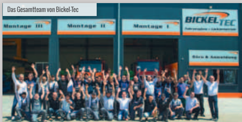
Das Gesamtteam von Bickel-Tec