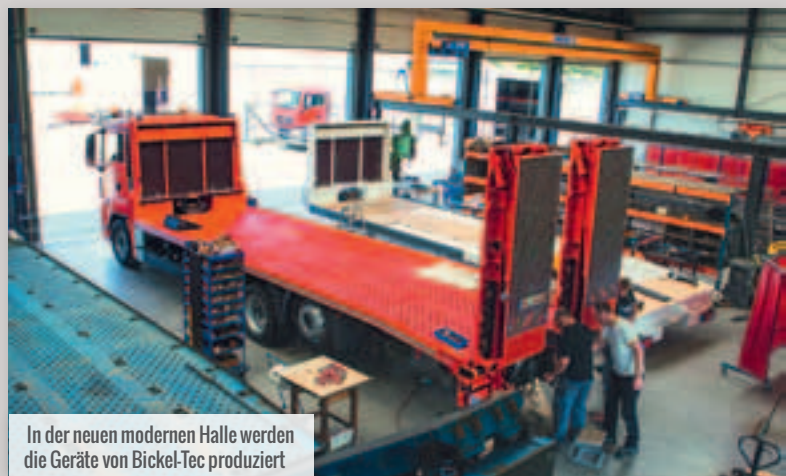
In der neuen modernen Halle werden die Geräte von Bickel-Tec produziert