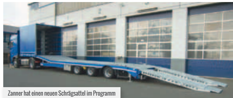
Zanner hat einen neuen Schrägsattel im Programm