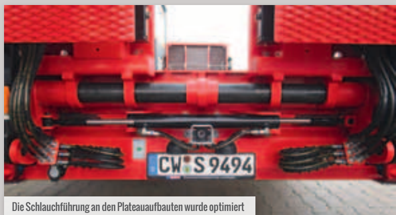
Die Schlauchführung an den Plateaufbauten wurde optimiert