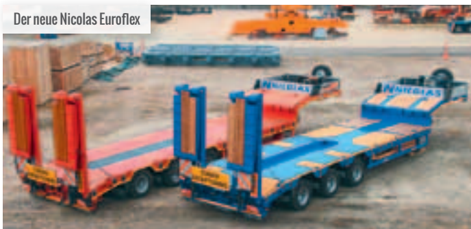
Der neue Nicolas Euroflex

Faymonville „goes Bayern“ und auch dort ist das Gewicht ein Entscheidungsgrund. Das Familienunternehmen Karl aus Innernzell im Bayrischen