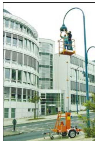
Kulis Dauerbrenner KBE5, einer von 14000

Auch bei Braviisol geht es um kompakte Dimensionen. Das italienische Unternehmen dürfte den inoffiziellen Weltrekord im Fertigen des schmalsten Personenliftes innehaben. Winzige 45 Zentimeter misst der Schmalhans unter den „Lui“s in der Breite, der Lui Slim. Seine breiteren Brüder Lui 400 und 900 bieten Arbeitshöhen von sechs bis neun Meter und sind 0,78 und 1,08 Meter breit. Etwas niedriger angesiedelt ist der „Klassiker“ Leonardo mit seinen knapp fünf Metern Arbeitshöhe. Und diese ist auch mit Höchstbelastung von 180 Kilo voll befahrbar. ▶▶