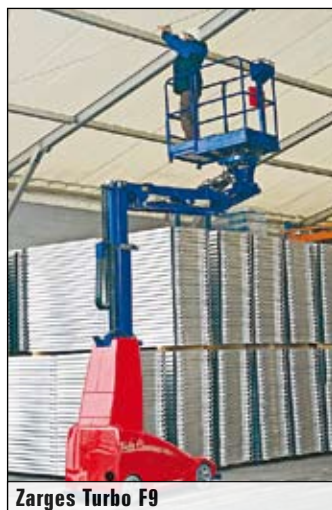
Zarges Turbo F9

« als Ablage für Werkzeug und Ähnliches dient, sorgt für zusätzliche Sicherheit. Wann diese Neuheit auf den europäischen Markt kommt, ist noch ungewiss. „Das CE-Zeichen fehlt noch. In etwa einem halben Jahr dürfte es soweit sein“, schätzt Walter Van Winkel, Kaufmännischer Direktor bei JLG International. Des Weiteren hält JLG eine sehr große Palette an Senkrechtliften bereit – von den Toucan-Selbstfahrern über die verschiebbaren PM und Access Master bis hin zum zuletzt eingeführten ES 1230, der von der Nomenklatur in die Scherenkategorie einsortiert wurde; aufgrund der Technik.