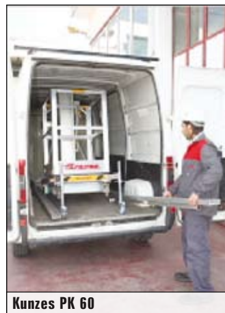
Kunzes PK 60

Auch Upright kommt mit Pusharounds und Selbstfahrern daher. Erstere sind am Markt bewährt – vom UL 25 über den UL 32 bis hin zu den großen UL 40 und 46, allesamt Indoor-Spezialisten für Arbeitshöhen zwischen zehn und 14 Meter. An Mastliften stehen die TM12 sowie die beiden MB20N und MB26 parat. Sie decken den Bereich sechs bis zehn Meter