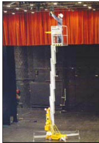
Beleuchtungseinsatz für den Haulotte QuickUp 12

Am Anfang war das A – Airo, die Alp-Lifte und die Alp AG wären hier zu nennen. Während Airo im Herbst eine regelrechte Scherenbühnen-Offensive gestartet hat, bleibt bei den Personenliften alles beim Alten. Unverändert werden die kleine Micra 290 sowie die Modellreihen PK und VG angeboten. Mit Airo-Modellen handelt auch die Alp AG mit Sitz im schweizerischen Winterthur. Und, der Name verrät es, mit Alp-Liften.