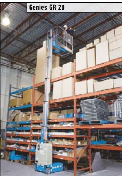
Genies GR 20