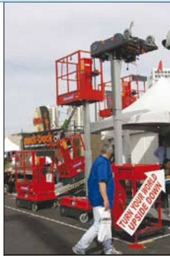
Braviisol zeigt seine Leonardos in Las Vegas

« C Der dritte Buchstabe im Alphabet steht für gleich drei Hersteller. Einmal die französische Comabi, seit 1999 zu Zarges gehörend (siehe weiter unten); des Weiteren für Copma aus Italien und zuletzt für Crown.