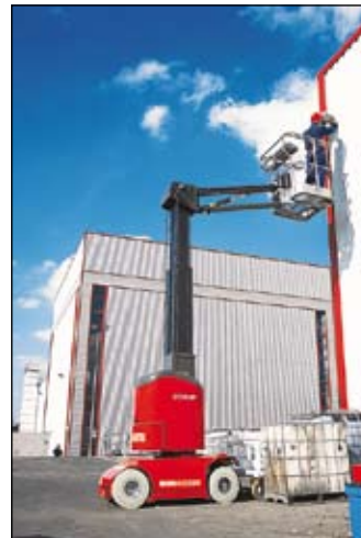
Unverändert zu haben ist Manitou 80 VJR