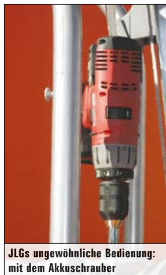
JLGs ungewöhnliche Bedienung: mit dem Akkuschauber

Gut am Markt etabliert hat der französische Hersteller Haulotte seine Personenlifte wie die zuletzt eingeführte Mastbühne Star 10 und die aus derselben Baureihe stammenden