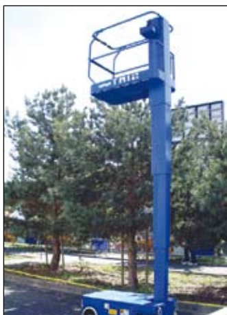
Der TM12 von Upright

Lang am etabliert sind die elektrisch betriebenen Vertikallifte von Manitou. Sie hören auf den Namen 80 VJR und 105 VJR und steuern Arbeitshöhen an im Bereich von knapp acht bis gut zehn Meter. Ihre Reichweite liegt bei 3,3 Meter. Sie nehmen maximal 200 Kilo auf, bringen selbst aber 2400 und 3280 Kilogramm auf die Waage. Knapp unterschreiten die Abmaße die Ein- und Zwei-Meter-Marke: die Breite beträgt 0,99 Meter, die Höhe 1,99 Meter. Während die kleinere nur für den