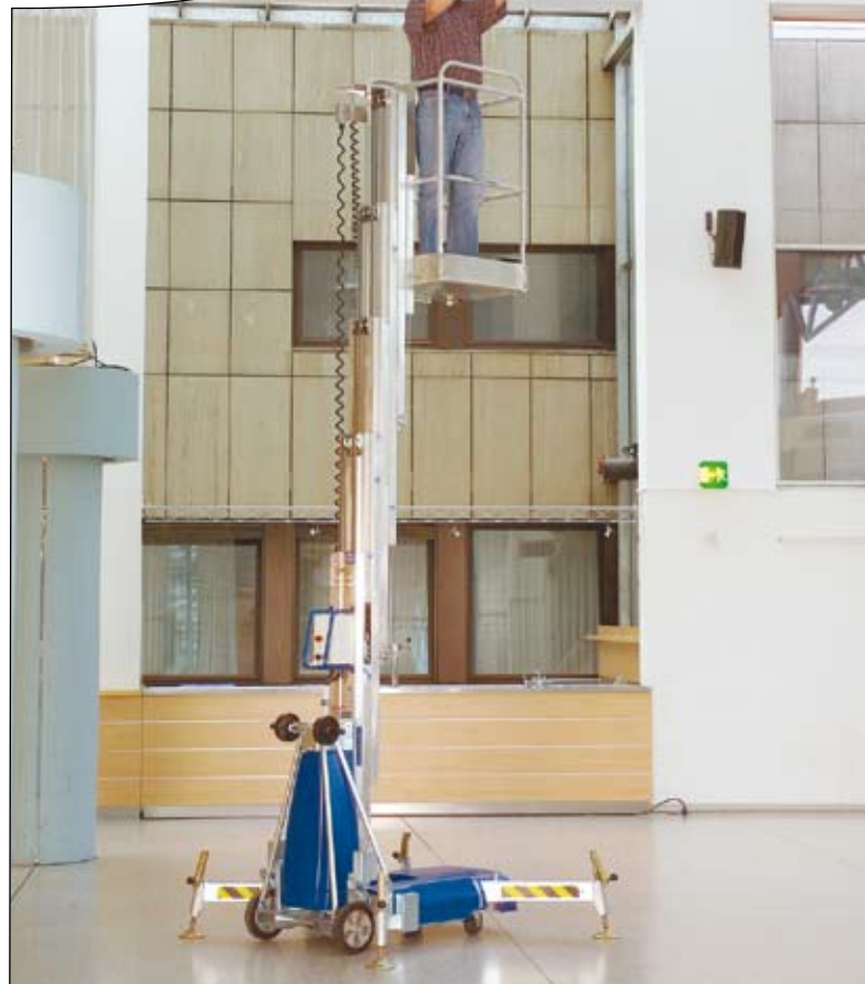
Ein Alp-Lift von Böcker