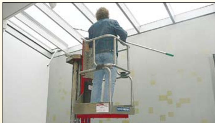
...für Arbeiten in der Höhe

das passende Gerät. Nach der Besichtigung vor Ort stand fest: Ein Senkrechtlift Vectur UL 48 ist das passende Gerät für den Einsatz; 16,6 Meter hoch, 530 Kilogramm schwer und im Transportzustand klein genug, um durch die schmale Tür zu passen.