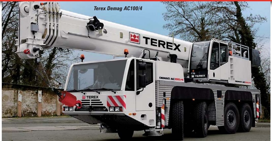
Terex Demag AC100/4

La siguiente parada es el stand de Manitowoc donde encontrará