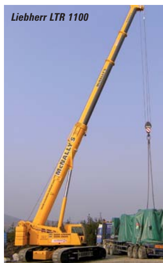
Liebherr LTR 1100

Moving around the perimeter of the Gold Lot you will see the all hydraulic Manitowoc Model 14000. In spite of its 2006 launch, this is its US show debut. The 200 tonner