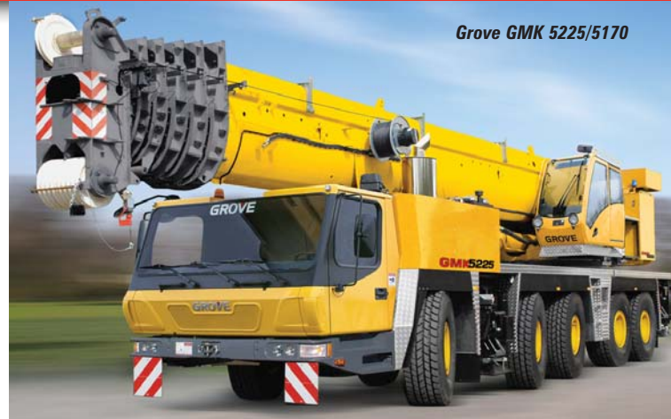
Grove GMK 5225/5170

truck cranes, the 35 tonne TM500E-2 (which replaces the TM500E) on a commercial chassis with a maximum tip height of 154ft (47m). The crane's chassis is built to Grove's specifications and features a sprung front axle with air suspension on the rear which gives an improved ride at speeds up to 65 mph. The 100 tonne TMS9000E (replaces the TMS900E), features a five-section,