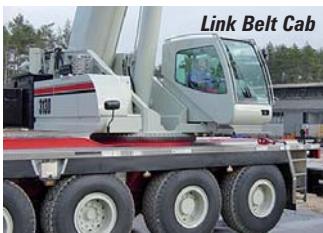
Link Belt Cab

Comenzando en el gran stand de Terex encontrará la grúa Demag AC100/4 que ha comenzado a embarcarse recientemente. Esta será la primera oportunidad de muchos comparadores estadounidenses de ver esta grúa de 100 t, cuatro ejes, que fue lanzada por primera vez en Bauma. La máxima altura de elevación son 254ft (77m) alcanzados con una pluma principal de 165ft (50m) y extensión de 89ft (27m).