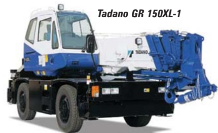
Tadano GR 150XL-1

Ahora vaya al área Blue para ver el stand de Lift Systems que cuenta con una nueva grúa de 30 ton pick and carry Mobilift. Su capacidad máxima se da a un radio de 6 ft mientras puede llevar 10 tons a 20ft. La empresa tiene un nuevo sistema de gatos de 100 ton.