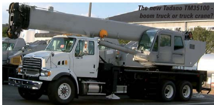
The new Tadano TM35100 - boom truck or truck crane?

Cruce la calle ahora hacia el área Silver - 3, donde encontrará al fabricante chino XCMG que expondrá dos grúas sobre camión, el modelo 30K de 37 ton y el modelo 60K de 75 ton. Ambos modelos estarán listos para ser probados en Las Vegas inmediatamente después de la feria. Otro fabricante chino, Zoomlion todavía no ha confirmado si expondrá algún Nuevo producto Zoomlion o si las grúas estarán en los stands de sus distribuidores - Lewis Equipment - localizado en el área Blue.