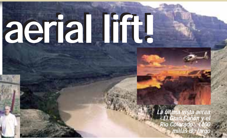
The ultimate 'Aerial View' - The Grand Canyon and the great Colorado River - 1400 miles long.