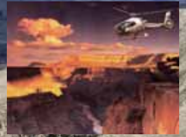
La última vista aérea - El Gran Cañón y el Río Colorado - 1400 millas de largo