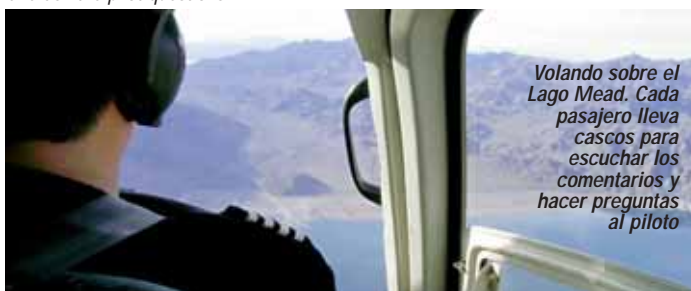
Volando sobre el Lago Mead. Cada pasajero lleva cascos para escuchar los comentarios y hacer preguntas al piloto

Flying over Lake Mead. Each passenger wears headphones to listen to a commentary and ask the pilot questions.