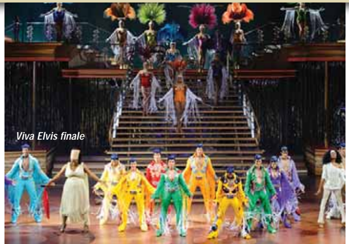
Viva Elvis finale

Carrot Top the red headed 'prop comedian' at the Luxor.