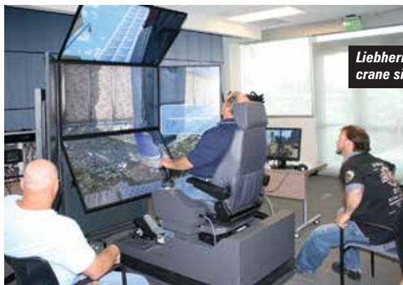
Liebherr crawler crane simulator

the updated MC285-2. Now head past the Vertikal Stand and into Area 5 to find GGR and the Unic spider cranes. The company says that it will have a surprise or two in addition to its top of the range 10 tonnes URW-1006. Japan's other spider crane maker R&B is represented by France Elévateur at the top of the area. Hitachi Sumitomo in Hall 6 does not have a crane this year, while Zoomlion in Hall 7 might, but has not confirmed. If you are into foundation cranes Soilmec is in Hall 5b, while the others are in outside area 2 just across the road.