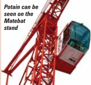
Potain can be seen on the Matebat stand

Enfin il peut être intéressant de vous diriger vers le hall 7 pour y trouver Zoomlion et voir comment va la commercialisation de la grue « flat top » de dessin Jost, présentée comme un prototype lors de l'Intermat 2012.