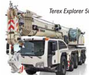
Terex Explorer 5600

aluminium cranes on the Chastagner stand. A few steps further brings you to Terex Cranes which is highlighting the Explorer 5600 launched last year at Conexpo. Of particular interest is the company's new asymmetric outrigger system. Finally we head to the Böcker stand to see its latest aluminium truck mounted cranes, ideal for lifting lighter loads to heights of 40 metres and more. Finally you can head to Hall 7 to find Zoomlion which did not manage to organise a Rough Terrain this year.