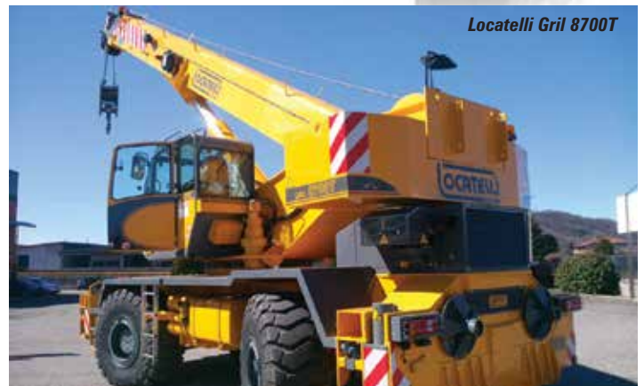
Locatelli Gril 8700T

Continue past the Vertikal Stand into area External 5 to find Klaas