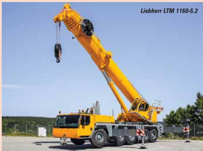
Liebherr LTM 1160-5.2

Nous débutons la visite sur le stand de Liebherr , dans la zone extérieure 6. La Compagnie profite de cette exposition pour le lancement européen de son LTM 1160-5.2 une