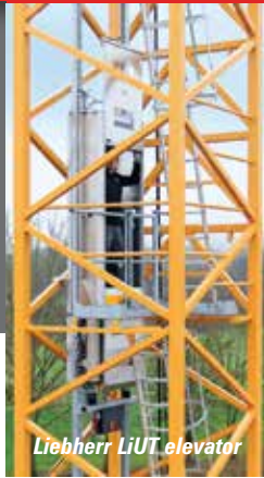
Liebherr LiUT elevator

While there are only a few tower cranes on show there are some interesting new products and accessories to see.