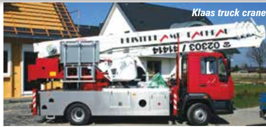
Klaas truck crane