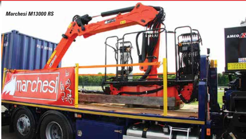
Marchesi M13000 RS

Mercedes Actros truck and equipped with an Ormet three person platform with 180 degrees of platform rotation. Other features include self-levelling and automatic stability control. The company will also show the 20 tonne/metre Icon 215, its all-new loader crane concept with the Progress 2.0 control system. Appydro is also the dealer for Marchesi .