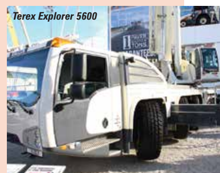
Terex Explorer 5600

lancé à Conexpo l'année passée. A noter le nouveau système asymétrique de bras de calage. Nous visiterons le stand de Böcker pour voir ses dernières grues aluminium, montées sur camions. Une gamme idéale pour lever des charges légères à des hauteurs de 40m. et plus. Nous terminerons dans le hall 7 pour y trouver Zoomlion qui devrait exposer une de ses grues RT.