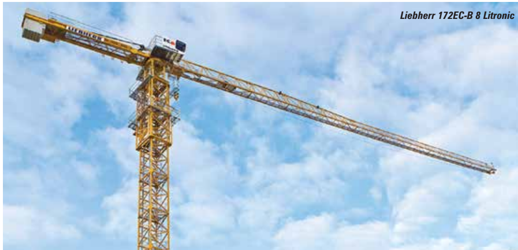
Liebherr 172EC-B 8 Litronic

which is showing its new 172EC-B 8 Litronic, the successor to the 160EC-B. The new eight tonne crane offers 15 percent better capacities and can handle 2.1 tonnes at the tip of its 60 metre jib. Of even more interest is the company's new LiUP two-man elevator, which installs internally on larger towers and externally on smaller cross sections. The LiUP is completely self-contained and autonomous using a lithium-ion battery mounted at the base which regenerates the battery as it comes down. As it does not require any supply cables, ropes or drag cables it can be installed and removed quickly and easily. Finally it might be worth heading over to Hall 7 to find Zoomlion to see how it is getting on with the Jost-designed flat top crane designs that it showed as a prototype at Intermat 2012.