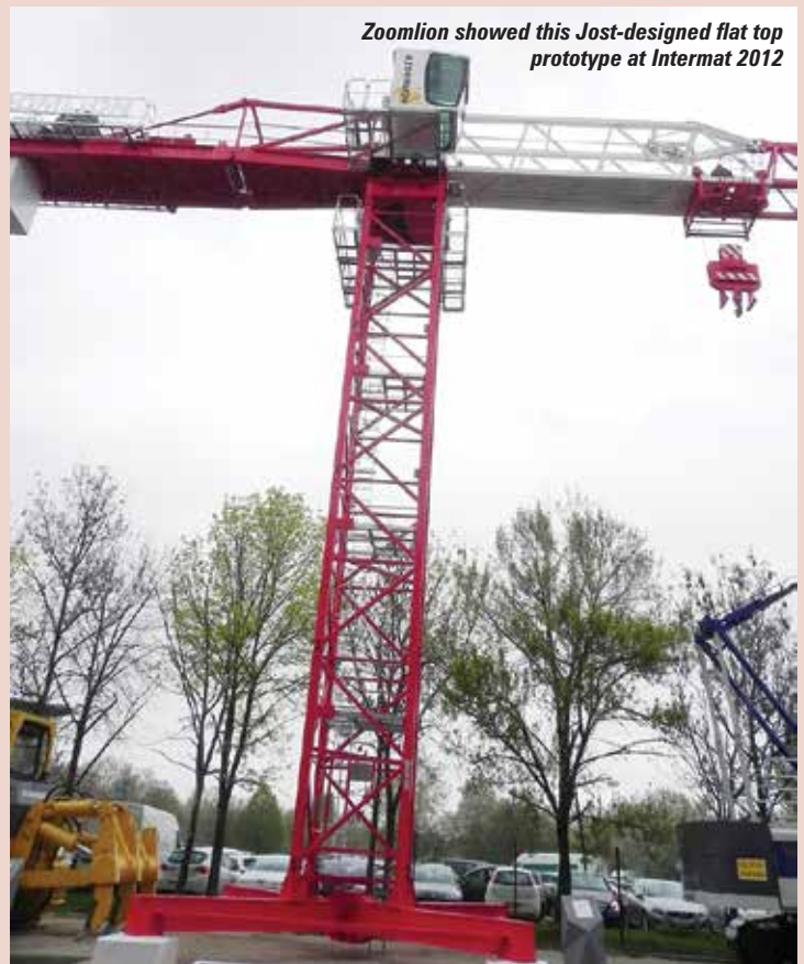
Zoomlion showed this Jost-designed flat top prototype at Intermat 2012