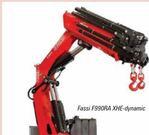
Fassi F990RA XHE-dynamic

Hydraulics et sa petite grue ultra compacte, vendue également sous le nom de MaxiLift .