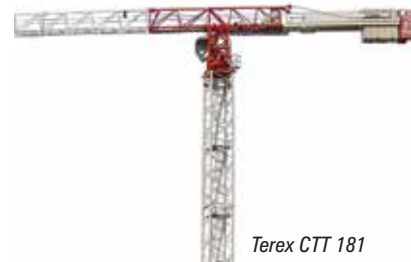
Terex CTT 181

Bien qu'il n'y ait que très peu de grues à tour sur l'exposition, il y a quelques nouveaux produits et accessoires intéressants à voir.