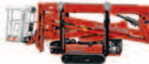
LIGHTLIFT 20.10 IIS Arbeitshöhe 20,10 m seitliche Reichweite 9,70 m Tragkraft Korb 230 kg