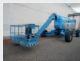
V22896 - Genie Z135-70RT - 2007 Diesel 4x4 - 43,15 Mtr. - 2405 Hrs. € 72.500