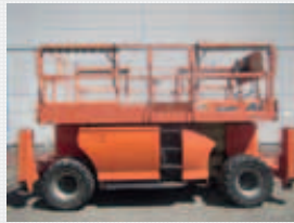
V19900 - Jlg 3394RT - 2006 Diesel 4x4 - 12,06 Mtr. - 2507 Hrs. € 12.950