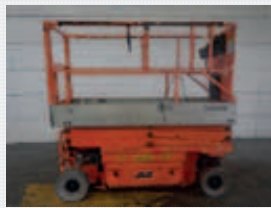
V22789 - Jlg 2030ES - 2004 Electric - 8,1 Mtr. - 567 Hrs. € 3.950