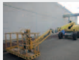
V21137 - Haulotte H23TPX - 2007 Diesel 4x4 - 22,6 Mtr. - 4838 Hrs. € 16.950