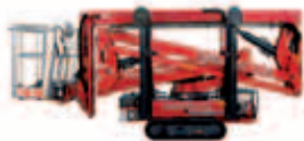
LIGHTLIFT 17.75 IIS Arbeitshöhe 17,00 m seitliche Reichweite 7,50 m Tragkraft Korb 230 kg