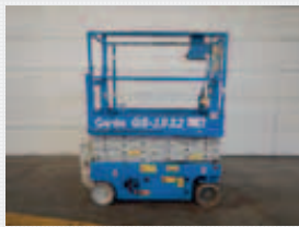
V23633 - Genie GS1932 - 2005 Electric - 7,8 Mtr. - 450 Hrs. € 3.500