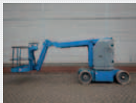
V22722 - Genie Z30-20N - 1999 Electric - 11,14 Mtr. - 1694 Hrs. € 8.500