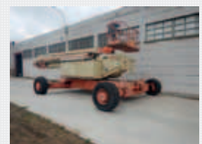
V22977 - Jlg 150HAX - 2000 Diesel 4x4 - 47,5 Mtr. - 5449 Hrs. € 59.500