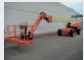
V19924 - Jlg 1200SJP - 2007 Diesel 4x4 - 38,58 Mtr. - 3626 Hrs. € 65.000