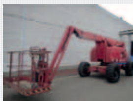
V21896 - Haulotte HA20PX - 2004 Diesel 4x4 - 20,65 Mtr. - 3611 Hrs. € 14.950