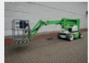
V22310 - Niftylift HR15NDE - 2008 Bi-Energy - 15,6 Mtr. - / Hrs. € 15.950