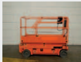
V23666 - Haulotte Compact 8 - 2007 Electric - 8,2 Mtr. - 498 Hrs. € 3.950