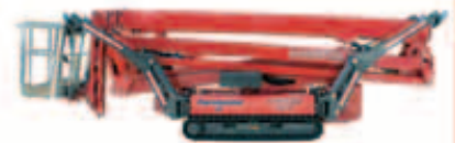
LIGHTLIFT 26.14 IIS Arbeitshöhe 25,70 m seitliche Reichweite 13,60 m Tragkraft Korb 230 kg