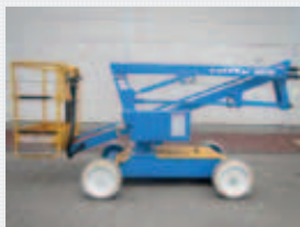
V21922 - Niftylift HR10E - 2001 Electric - 10 Mtr. - / Hrs. € 5.950