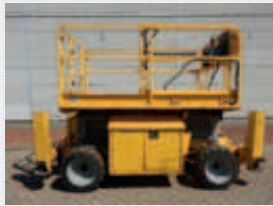
V22797 - Jlg 260MRT - 2007 Diesel 4x4 - 9,92 Mtr. - / Hrs. € 7.950