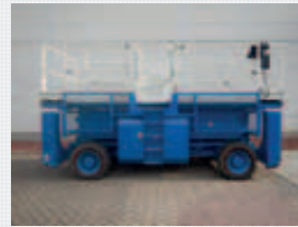
V22940 - Genie GS3384RT - 2006 Diesel 4x4 - 12,06 Mtr. - 1692 Hrs. € 9.950