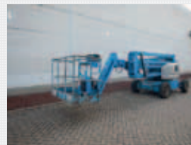
V22611 - Genie Z45-25JBI - 2005 Bi-Energy - 15,92 Mtr. - / Hrs. € 13.950