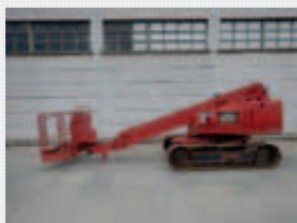
V22714 - Aichi SR123 - 2002 Diesel 4x4 - 14 Mtr. - 6437 Hrs. € 18.500