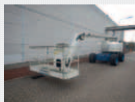
V22966 - Genie Z80-60RT - 2006 Diesel 4x4 - 26,4 Mtr. - 4258 Hrs. € 31.000