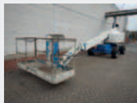
V22948 - Genie S45 - 2006 Diesel 4x4 - 15,7 Mtr. - 3629 Hrs. € 12.500