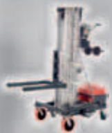
WLU-Premium Hubhöhe max.: 5,15 m Tragkraft max.: 400 kg