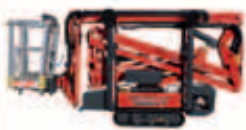
LIGHTLIFT 15.70 IIS Arbeitshöhe 15,40 m seitliche Reichweite 6,60 m Tragkraft Korb 230 kg