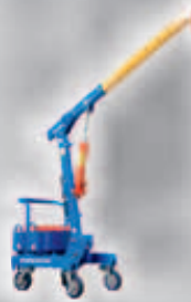
MFC750 Hubhöhe max.: 2,90 m Tragkraft max.: 900 kg

Norbert Wienold GmbH Material- und Personenlifte Industriegebiet Waldstr. 35 a D-48488 Emsbüren