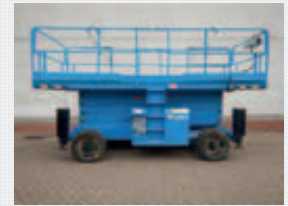
V22989 - Haulotte H185XL - 2007 Diesel 4x4 - 18 Mtr. - 1751 Hrs. € 14.950