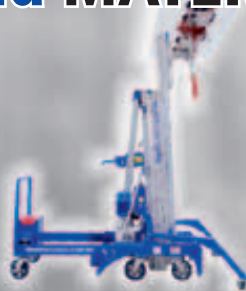
GML800+ Hubhöhe max.: 7,94 m Tragkraft max.: 900 kg