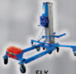
SLK Hubhöhe max.: 7,90 m Tragkraft max.: 300 kg