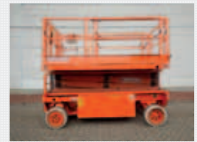
V23533 - Hollandlift X105EL16 - 2006 Electric - 12,5 Mtr. - 593 Hrs. € 5.950