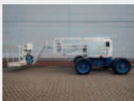
V22809 - Genie Z45-25JRT - 2005 Diesel 4x4 - 16 Mtr. - 2810 Hrs. € 13.950