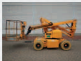
V23660 - Airo SG1000 - 2007 Electric - 12 Mtr. - 81 Hrs. € 8.500