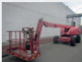
V21813 - Haulotte H16TPX - 2006 Diesel 4x4 - 15,44 Mtr. - 1675 Hrs. € 10.950