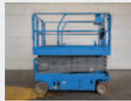
V22502 - Genie GS3246 - 2007 Electric - 11,75 Mtr. - 670 Hrs. € 6.950