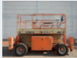
V22736 - Jlg 33RTS - 2000 Diesel 4x4 - 12,06 Mtr. - 5447 Hrs. € 6.950