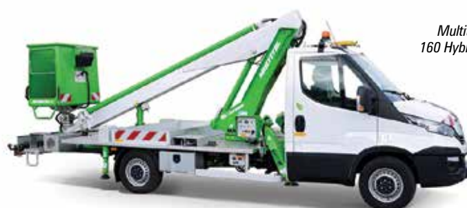
Multitel 160 Hybrid