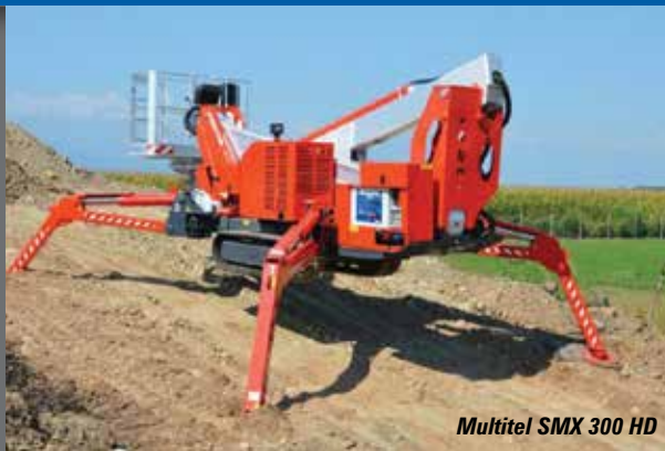
Multitel SMX 300 HD

metres outreach at a height of 17 metres and unrestricted platform capacity of 230kg. The jib also has 180 degrees of articulation. At the bottom of aisle G ATN has its 23 metre dual boom Mygale 23 bi-energy on the stand, with 11 metres outreach and 230kg platform capacity. On the other side of the Skyjack stand Platform Basket has its new 30 metre Spider 30 T telescopic, with an overall weight of 4,300kg and stowed width of 880mm. Also on the stand are the 33 metre dual boom Spider 33.15 with 15 metres outreach at a height of 19 metres and the 27 metre Spider 27.14. Moving to area E6 Palfinger will have a new spider lift on show and possibly the first fruits of its co-operation with Palazzani. Finally check out Imer in the same area.