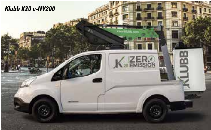
Klubb K20 e-NV200

Heading past the Vertikal booth, into area E6 to find Palfinger which is keeping any new launches secret to prevent any spoiling tactics by a competitor. But do check out its revamped 103 metre model on a Tadano crane chassis and the 75 metre P750 NX with 39 metres of outreach. Passing Tadano which does not market its truck mounted lifts in Europe or North America, we now head into Hall 6 to the Imer stand which has several Comet platforms at the show, including its new 12 metre Xiraffe 4x4 compact articulated boom lift and Solar big platform truck mounted lift.