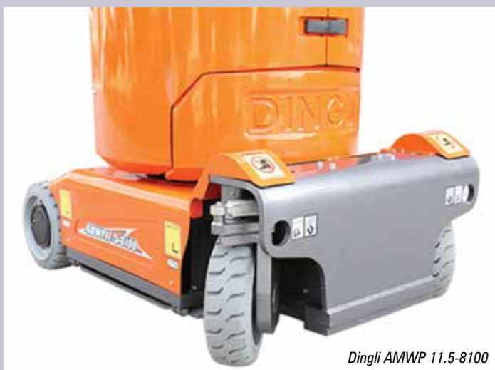
Dingli AMWP 11.5-8100

verticaux présentant une excellente finition. Puis arrêtons-nous chez Power Towers, une filiale de JLG. Il pourrait y avoir un mât vertical Toucan sur le stand, mais sûrement une présentation des plateformes de petite hauteur de travail, y compris la gamme innovante Peco, avec un système manuel d'élevation de la plateforme. Enfin dirigez-vous vers le hall 6 pour visiter Imer.