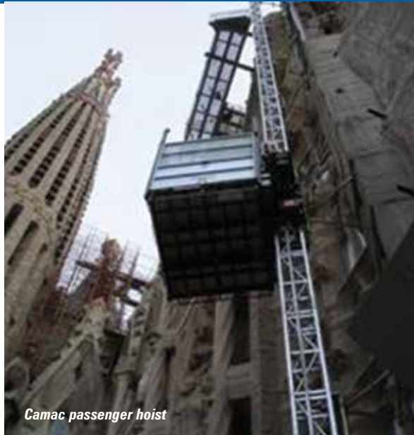
Camac passenger hoist

We begin our tour at the farthest edge of Hall 5B with the Italian company Maber - the company has full range of personnel, goods and construction hoists along with a leading line of mast climbing work and transport platforms. Heading towards the centre of the hall you will find Geda which has a vast array of products including rope and rack and pinion hoists and suspended work platforms. Nearby Canadian manufacturer Fraco has a selection from its mastclimber