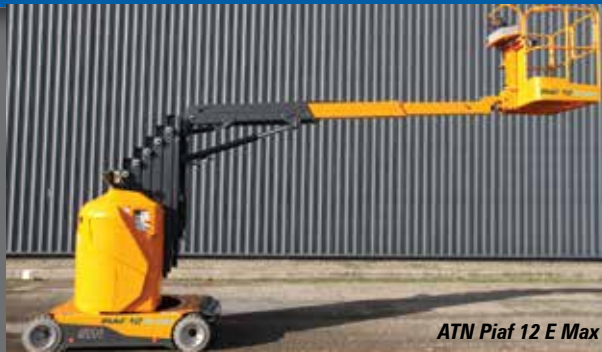
ATN Piaf 12 E Max