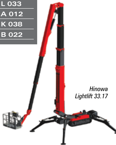
Hinowa Lightlift 33.17

We begin this tour in outside area E5 aisle B with Ommelift and its 18.25 metre compact 18.40 RXJ with 10.5 metres of outreach and end mounted platform, a stowed width of 790mm and true hybrid power pack. In the same aisle Ruthmann Bluelift may have the 31 metre SA31 it is developing, with dual risers, four section boom and jib and 17.5 metres outreach.