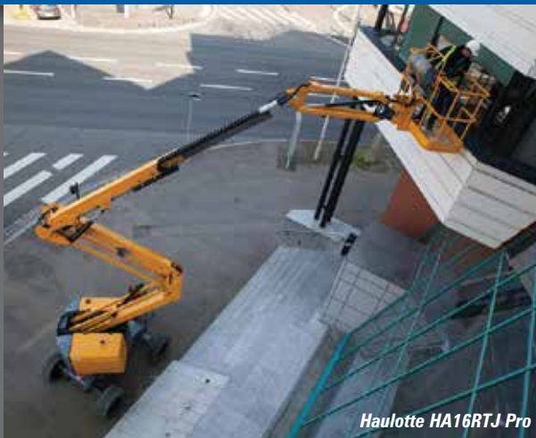
Haulotte HA16RTJ Pro

We start the tour on the Vertical stand outside between E5 and E6, with guide in hand it is a short distance to Haulotte which is promising a big surprise and may include a number of new models, including a new small boom lift.