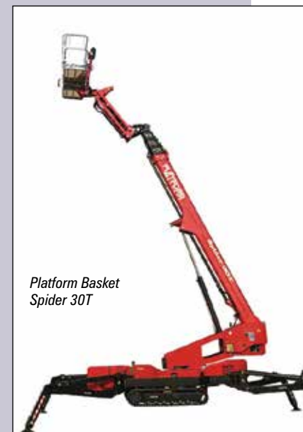
Platform Basket Spider 30T

De l'autre côté de Skyjack vous trouverez Platform Basket et sa nouvelle grue araignée télescopique de 30 tonnes - Spider 30 T - d'un