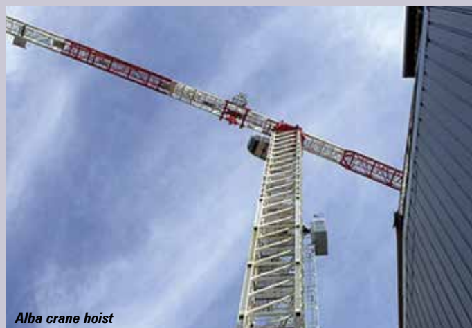
Alba crane hoist

nous faisons le tour du hall 5B, dépassons le stand Vertikal et nous dirigeons vers Electroelsa qui présente des treuils de base à crémaillère, à pignons ainsi que des plateformes de transport et des mâts grimpants. Les capacités vont de 400 à 5.000kg, avec des plateformes mesurant jusqu'à 51m.