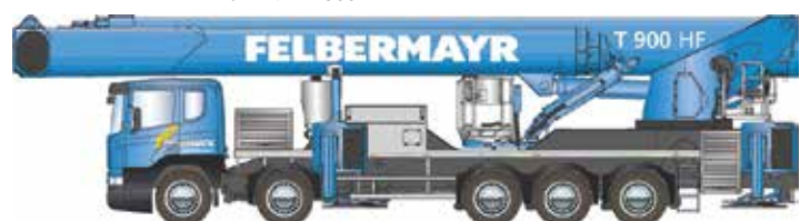
Ruthmann T900 HF