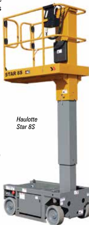
Haulotte Star 8S

electric drive 16ft mast type lift and might have its new lightweight S3215L. Across the aisle Skyjack has a huge display with most of its scissors on show. While no new models are expected check the new Elevate telematics and prototype ultrasound overhead protection system. Over the aisle ATN will have one of its Rough Terrain scissors on display. Follow the aisle all the way now to Airo, check its new 40ft X14 EN and 46ft X16 EVW compact narrow aisle scissor lifts with 1.5 metre platform extensions and full height drive. Moving towards the Halls you find ELS with its new 12ft ELS Junior 5.5SP self-propelled micro scissor lift. Heading back again stop at Magni to see the latest Dingli scissor lifts, before entering Hall 5B to see new entrant Lingong/LCMG. Next head past Manitou to Power Towers - part of JLG - which will have its latest low level self-propelled lifts on show.