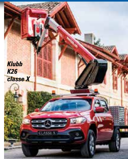
Klubb K26 classe X

Cette visite est plus facile car la plupart des constructeurs de grues sur camion sont placés dans la même zone extérieure, avec un grand nombre en zone E5 et c'est là que nous débutons sur le stand Klaas, dans l'allée A.