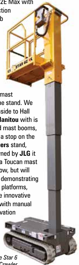
Haulotte Star 6 Crawler

Also check the tracked mast booms on the stand. We now head inside to Hall 5B to find Manitou with its well finished mast booms, followed by a stop on the Power Towers stand, which is owned by JLG it might have a Toucan mast boom on show, but will certainly be demonstrating its low level platforms, including the innovative Peco range with manual platform elevation system. Finally head into Hall 6 for Imer.