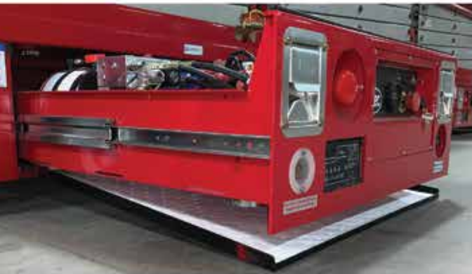
Patent-Pending Integrated Leak Containment System™ (LCS)