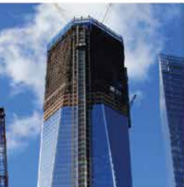
MAST-CLIMBING WORK PLATFORM