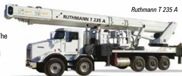
Ruthmann T 235 A

Scorpion telescopic truck mount-the 62ft A62, with 38ft/11.6 metres of outreach and 250kg platform capacity. Manitex cranes are also convertible to work platform duties. Finally over the aisle are Manitowoc and National Crane which may have a crane rigged with a platform.