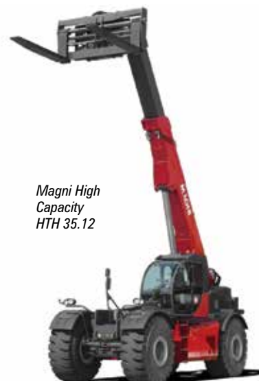
Magni High Capacity HTH 35.12

Finally head to the North Hall where Pettibone is celebrating the 50 th anniversary of its first telehandler, with a new 12,000lbs/46ft (5,400kg/14.1m) Traverse T1246X telehandler with 1.8 metres of horizontal boom base movement. In the Blue lot Chinese manufacturer Sunward is also launching a North American specification telehandler with its 6,000lbs/34.5ft (10.5m/2,722kg) SWTH-634 which the company may assemble in Texas.