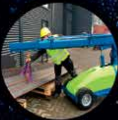
Winlet Lasius Pick & Carry Crane