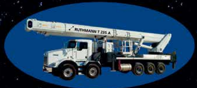
Ruthmann T235 A - 235 ft. wk ht