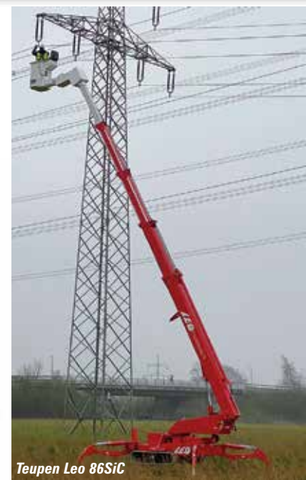
Teupen Leo 86SiC

Spider lifts are growing in popularity in North America and while penetration remains low, the sheer size of the US powered access market makes it one of the largest spider lift markets in the world, especially in the tree care market. All machines are imported from Italy, Germany, Denmark or Finland, so most launches are scheduled for European shows, but there is still plenty to see.