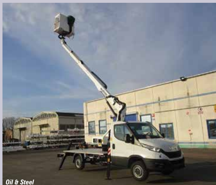
Oil & Steel

A62 de 62 pies, con alcance de 38 pies/11,6 metros y una capacidad de plataforma de 250 kg. Las grúas Manitex también son convertibles para tareas de plataforma de trabajo. Finalmente sobre el pasillo están Manitowoc y National Crane, que pueden tener una plataforma montada en una grúa.