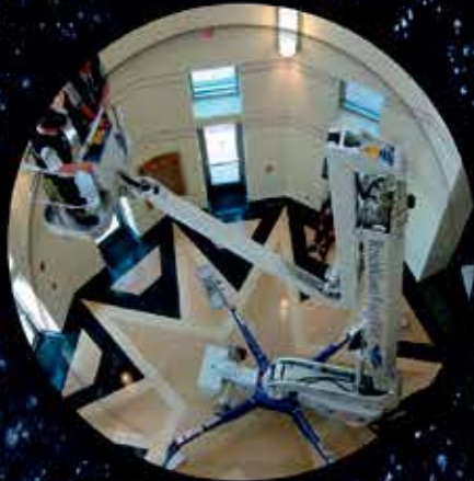
Falcon Series 95-170 ft. wk ht