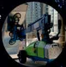
Winlet Series-Models 770-2200