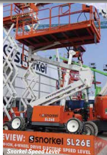
Snorkel Speed Level