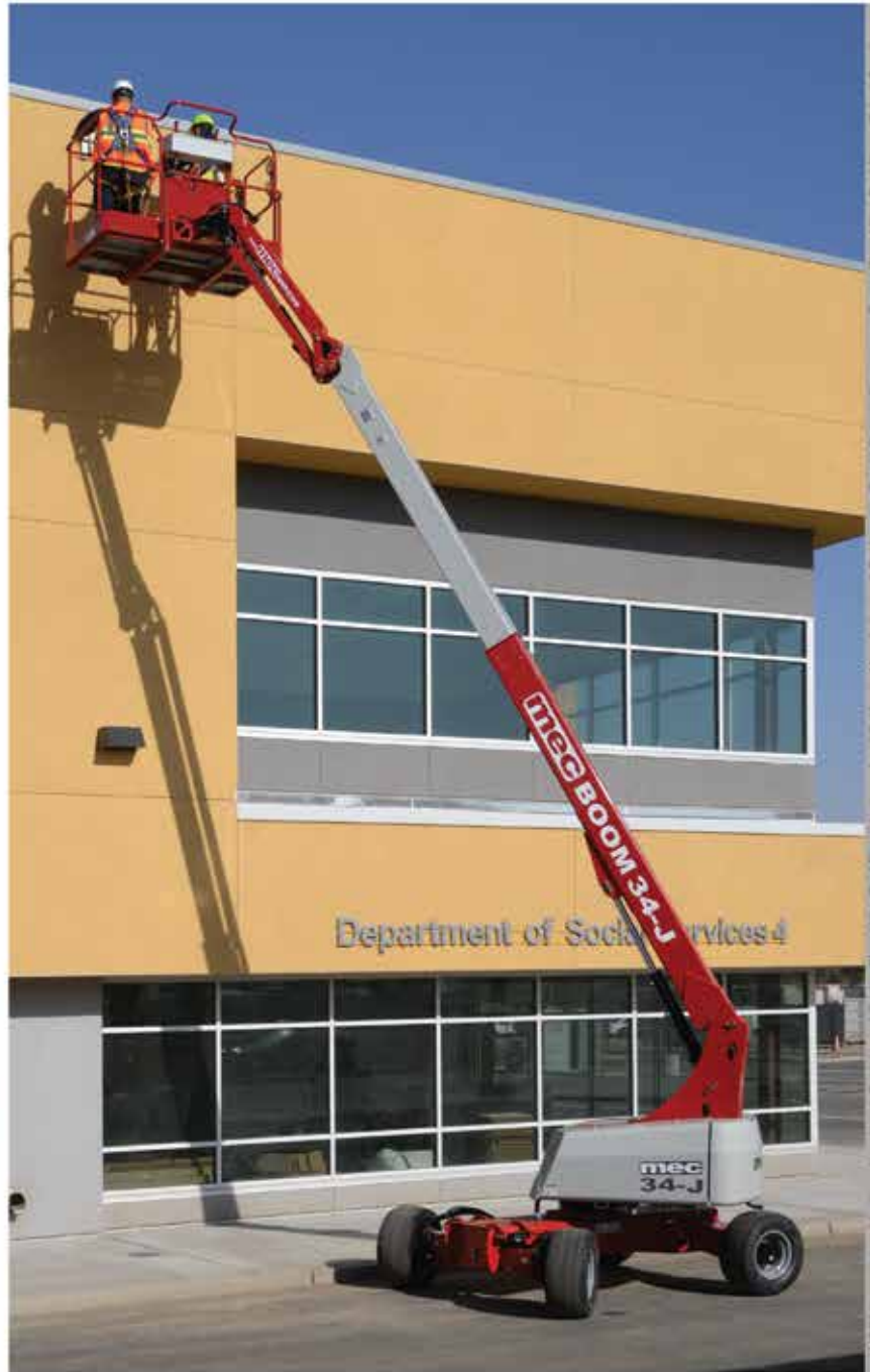
Micro Weight, Construction Duty 40 ft. Work Height Solution (MEC 34-J)

MEC Aerial Work Platforms | Phone: (559) 842-1500 Toll free (USA): 1(877) MEC-LIFT (632-5438) | www.MECawp.com