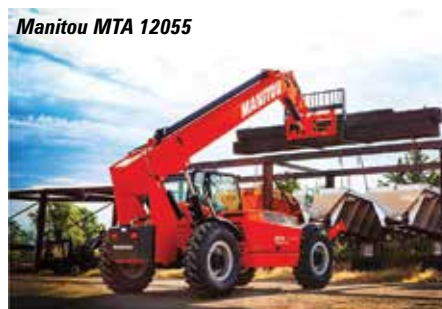
Manitou MTA 12055