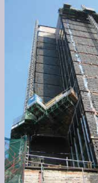
Hydro Mobile F Series

Finalmente, puede dirigirse hacia el pabellón Festival Hall parando para ver si Jaso tiene un elevador en su stand, y vea a Harrington Hoists, que está dentro del pabellón.