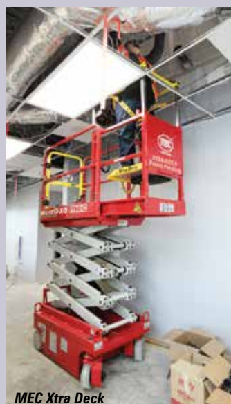
MEC Xtra Deck