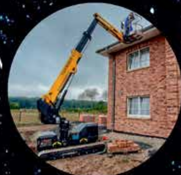
Jibbi 40BL-EVO - 40 ft. wk ht