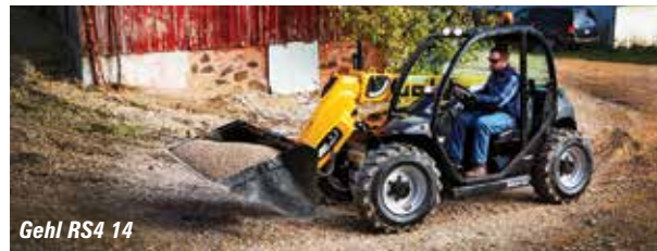
Gehl RS4 14

Wacker Neuson is close by, but unlikely to have a telehandler on show,