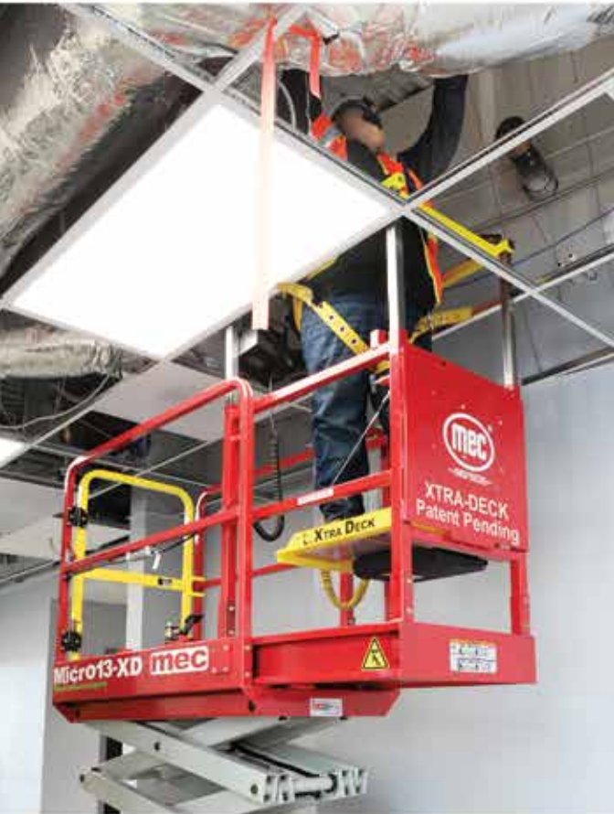
Patent-Pending Xtra-Deck™ (MEC Micro13-XD & Micro19-XD)