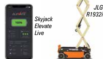
Skyjack Elevate Live

Over the aisle is LGMG headed by industry veteran Craig Paylor. Finally hop on the bus to the Blue lot to see Dingli with its new 66ft JCPT2223RTB and Sinoboom which also has new models on show. Finally Pettibone is in the North Hall.