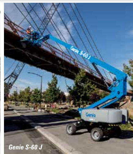
Genie S-60 J

Over the Aisle is LGMG with three boom lifts, the 45ft A45JE , 52ft AR52J and 65ft T65J , then past Zoomlion to Manitou with its new Ansi specification 65, 80 and 85ft booms, and maybe the all electric 200ATJ Rough Terrain boom.