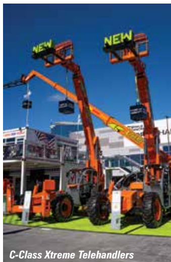
C-Class Xtreme Telehandlers

Comenzamos el recorrido más cercano a la entrada del autobús de enlace, con el fabricante italiano Dieci , que tiene sus unidades compactas junto con al menos un modelo Hercules con una capacidad de hasta 25 toneladas, y sus unidades Pegasus de 360 grados con alturas de elevación de casi 30 metros. Diríjase hacia el pabellón para encontrar Magni , que una vez