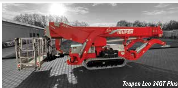
Teupen Leo 34GT Plus