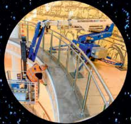
Bitelift Series 35-101 ft. wk ht