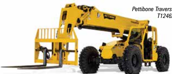
Pettibone Traverse T1246X