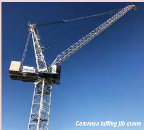
Comansa luffing jib crane

50 tonne 21LC1050 and 66 tonne 21LC1400 models, as well as its latest technology. Alongside Jaso is showing the 18 tonne J265PA luffer.