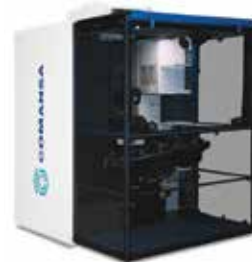
Comansa Cube Cab

50 tonne 21LC1050 and 66 tonne 21LC1400 models, as well as its latest technology. Alongside Jaso is showing the 18 tonne J265PA luffer.