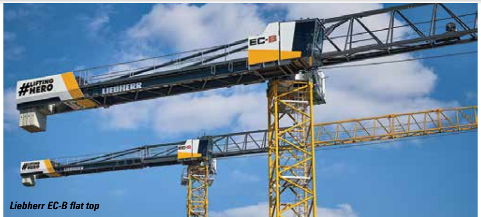
Liebherr EC-B flat top

another hydraulic luffer in the form of the 12 tonne 166B with 55 metre jib and 3.3 tonne jib tip capacity. Finally at back of the lot behind Link-Belt is Comansa with the 18 tonne LCL310 luffing jib crane, 60 metre jib and 3.5 tonne jib tip capacity. Check out the highly distinctive Cube Cab and learn more about its new