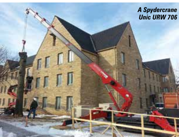
A Spydercrane Unic URW 706