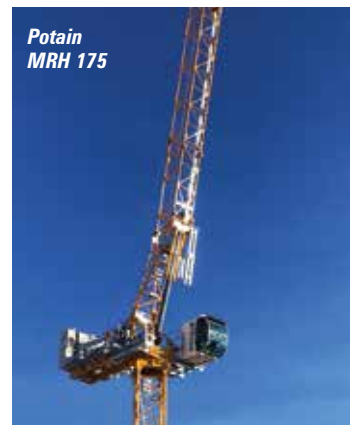
Potain MRH 175