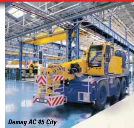
Demag AC 45 City

to see its 22 tonne Australian built Franna AT 22 articulated crane, one of the first times a Franna has been exhibited in the USA.