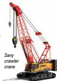
Sany crawler crane

Cruce el pasillo hacia XCMG , que debería tener una grúa sobre orugas en exhibición, pero hasta ahora no ha dicho qué modelo. En el pasillo detrás de Skyjack se encuentra el fabricante de grúas de cimentación Casagrande y el distribuidor de grúas araña Unic . Finalmente, la mayoría de los otros fabricantes de grúas de cimentación se pueden encontrar en el otro extremo del Festival Grounds, incluidos Mait y Soilmec . Si tiene la energía, puede subirse al autobús de enlace al Salón Central para ver Sennebogen y luego el Blue Lot para Sunward , que tendrá en exhibición sus grúas telescópicas sobre orugas.