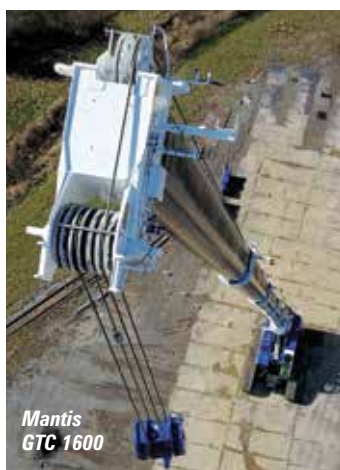
Mantis GTC 1600

Cross the aisle to XCMG which should have a crawler crane on display but has so far not said which model. Over the aisle behind Skyjack is foundation crane manufacturer Casagrande and Unic spider crane dealer Spydercrane . Finally most of the other foundation crane manufacturers can be found at the other end of the Festival Grounds, including Mait and Soilmec . If have the energy you can hop on the shuttle bus to the Central Hall to see Sennebogen and then the Blue Lot for Sunward which will have of its telescopic crawler cranes on show.