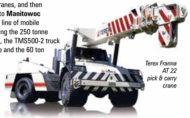
Terex Franna AT 22 pick & carry crane

On the other side of the stand Chinese manufacturer XCMG will show the XCT40U truck crane on a commercial chassis, most likely a Kenworth. There is also a chance that it will show a regular truck crane. Heading over to the other side of the lot you will find Ormig with its heavy duty pick & carry cranes. Moving towards the shuttle buses stop off at JMG to see its latest pick & carry cranes, possibly including a new model. Finally if you want to see the first fruits of Load King's purchase of the Terex truck crane assets - in the form of an 80 ton truck crane on a commercial chassis, with six section 48 metre boom - head to the Kenworth truck stand in South Hall 2.