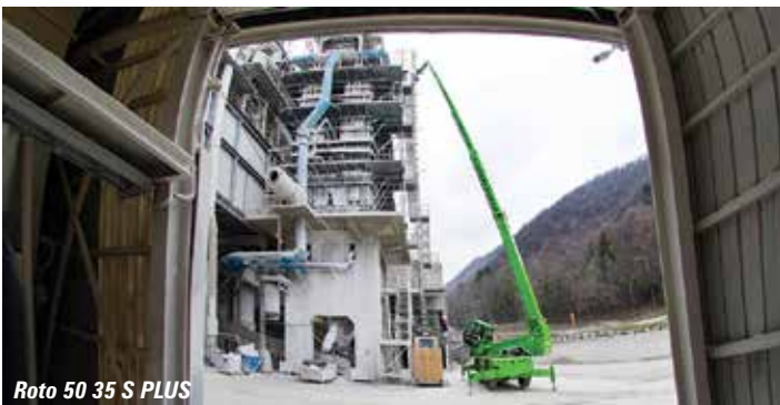
Roto 50 35 S PLUS

We begin the telehandler tour in Area FS near the U2 Messestadt Ost station entrance, turn right and walk along the perimeter to Snorkel which has launched its first telehandlers, all built by Faresin. They include the 4,200kg/13.5 metre SR9244 with a forward reach of 9.5 metres and the 4,535kg/16.4 metre SR1054 with 12.6 metres forward reach. Next stop Turkish aerial lift