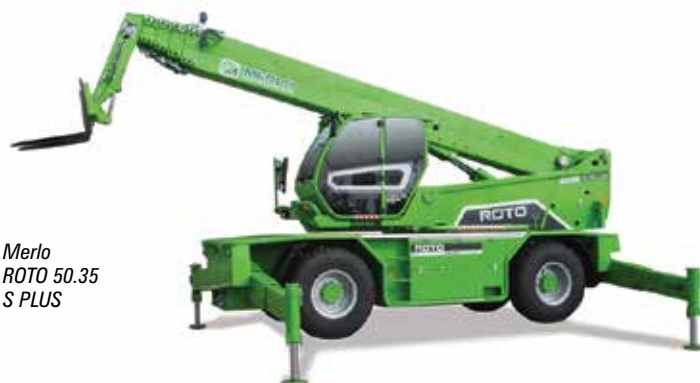
Merlo ROTO 50.35 S PLUS

Wir beginnen die Teleskopklader-Runde im Freigelände Süd (FS) nahe des Eingangs Messestadt Ost, biegen nach rechts ab und gehen entlang der äußeren Begrenzung zum US-Hersteller Snorkel , der seine ersten Teleskopklader auf den Markt gebracht hat, allesamt von Faresin gebaut. So der SR9244 (4,5 Tonnen/13,5 Meter) mit einer Reichweite von 9,5 Metern nach vorne und das 4,5 Tonnen/16,4 Meter bietende Modell SR1054. Der türkische Bühnenhersteller ELS macht mit einem 6 Meter/3,2 Tonnen Modell seinen ersten Schritt in den Telehandlermarkt; der Prototyp wurde in Partnerschaft mit der Sanko Holding entwickelt, die die MST-Teleskopklader baut.