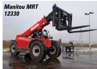
Manitou MRT 12330