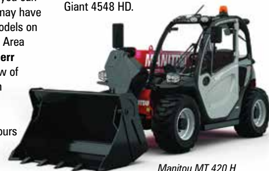
Manitou MT 420 H

Heading due east, we find Tobroco Giant which is launching a wider, more powerful compact telehandler, the 5048. Also ask about its new electric telehandlers that it currently has on the drawing board. As we head south back to the main area stop at Kubota which sells a badged version of the Giant 4548 HD.