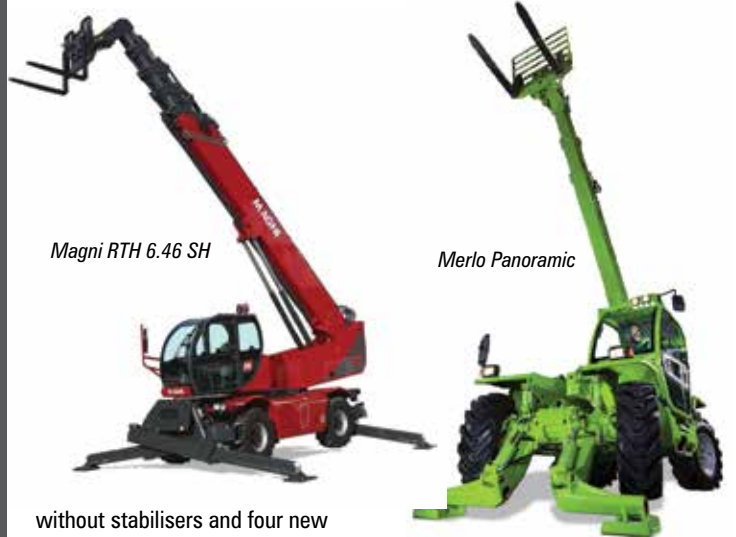
Magni RTH 6.46 SH