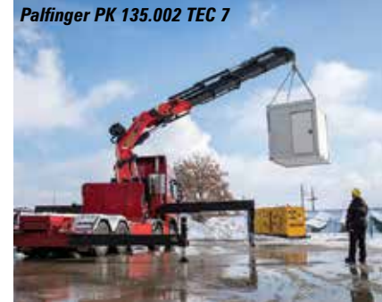
Palfinger PK 135.002 TEC 7

Wir starten die Tour am Vertikal-Stand und gelangen via Liebherr zu Atlas , das sein 100-jähriges Bestehen mit sechs Exponaten feiert, darunter der neue 26mt 262V ST Baustoffkran sowie die aktualisierten Modelle 256.3 und 226.3. Gehen Sie in den Bereich FN, um die massiven Knickarmkrane von World Power zu sehen. Hiab und Effer , jetzt zusammen, liegen direkt gegenüber. Effer hat zwei neue leichte Ladekrane im Bereich von 5 bis 11 mt und zeigen wohl auch seinen 2255, der 55 Meter Reichweite bietet. Hiab bringt den 58 mt X-HiPro 658 mit 17 Meter horizontaler Reichweite. Hinter Hiab befinden sich zwei neue Fassi XE-Dynamik-Ladekrane der 30- und 35mt-Klasse mit FX-Link, Endlosschwenkwerk, umfassender elektrohydraulischer Ausrüstung und zwei bis acht Ausschüben.