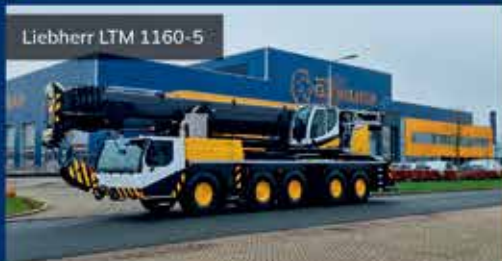
Liebherr LTM 1160-5